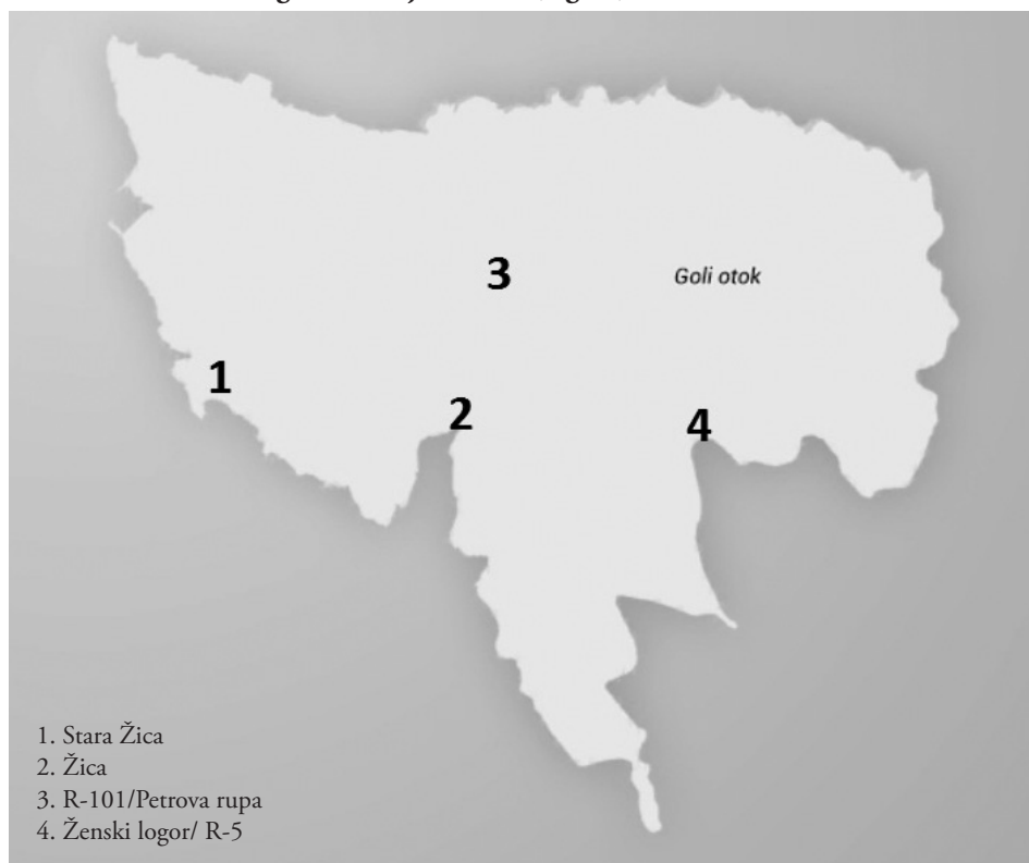
Prilog 2. Položaj radilišta (logora) na Golom otoku

Prije iznošenja procjene broja logoraša na Golom otoku, kao i drugim mjestima internacije ibeoce, potrebno je razjasniti način okvirnog procjenjivanja. Dokumenti navode dan hapšenja određene osobe, ali taj dan ne znači dan kada je osoba bila internirana na Goli otok ili neki drugi ibeovski logor. Dan hapšenja je zapravo početak istrage, koja je na osnovi dosjea ibeoce kao i svjedočanstava preživjelih golotočana, a i velike memoarske literature, vremenski varirala od jednog mjeseca pa sve do jedne godine, a nekada i više. Naročito su duge bile istrage vojnih lica gdje