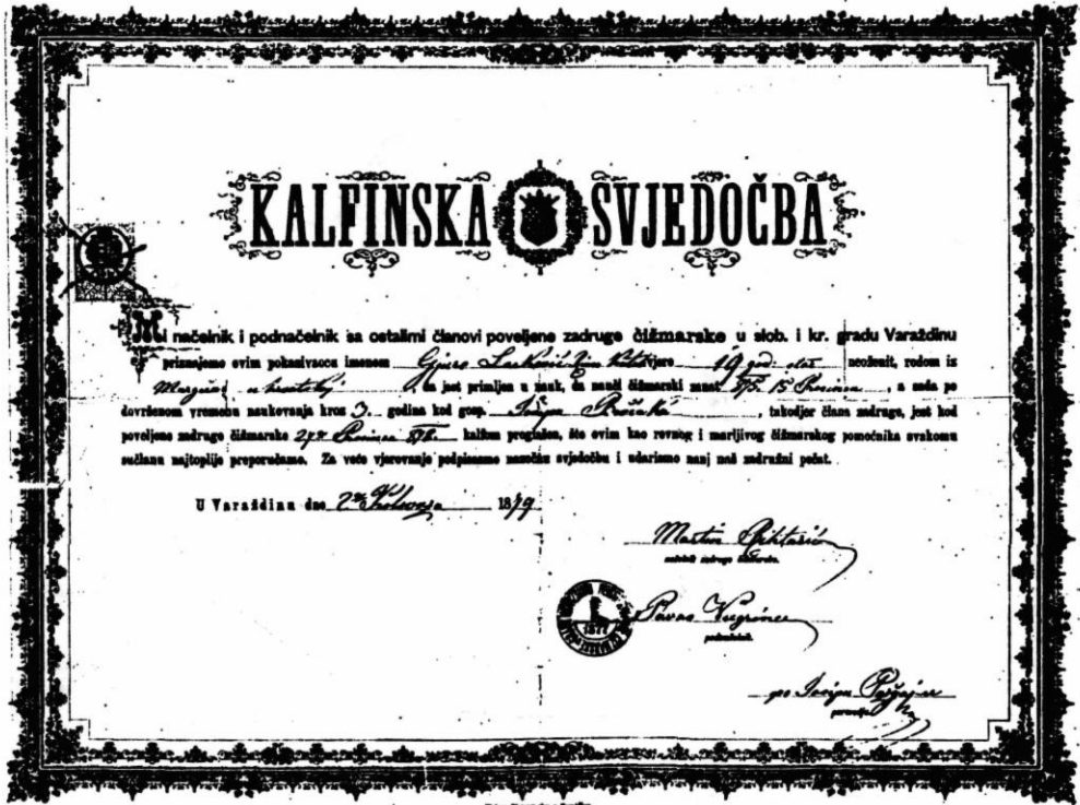
Dječička (kalfinska) svjedodžba što ju je Gjuri Lackoviću izdala Poveljna zadruga čizmarska u Varaždinu 1879. godine