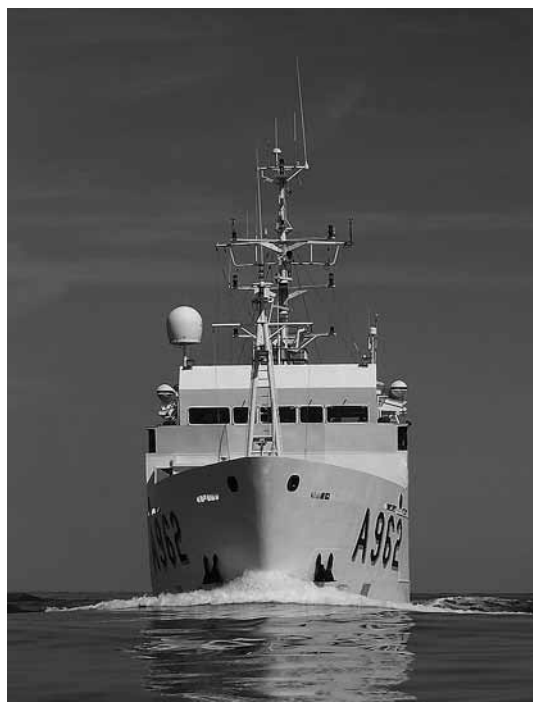
sl.1. Oceanografski brod Belgica , Institut royal des Sciences Naturelles de Belgique.

WIM DEVOS □ Ured federalne znanstvene politike, Bruxelles, Belgija