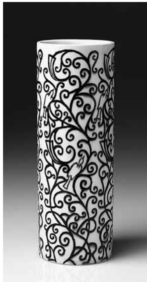
sl.3. Stojeći sat , Hamburg - Amerikanske Uhrenfabrik. Muzej za umjetnost i obrt