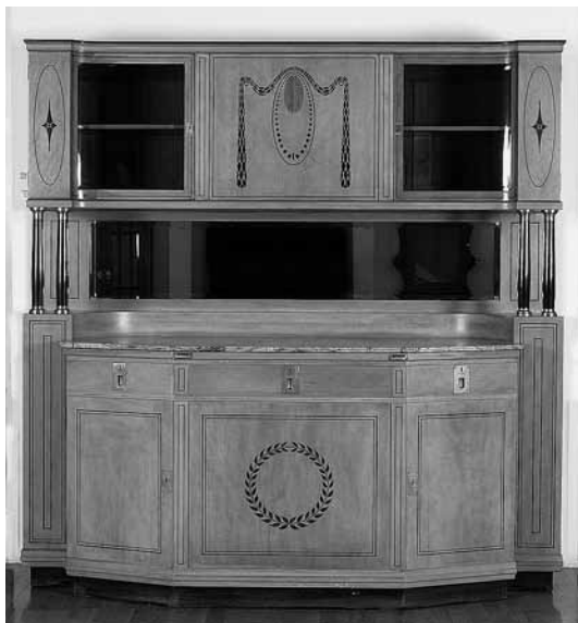
sl.8. Kredenc, Viktor Kovačić, Muzej za umjetnost i obrt, Zagreb

nemogućim. Tijekom cijelog trajanja projekta nastoji se stvoriti optimalan terminološki aparat koji bi sadržavao sve pojmove povezane s referentnim pojmovima na AAT-u 5 i omogućio što kvalitetniju obradu predmeta i njihovo mapiranje.