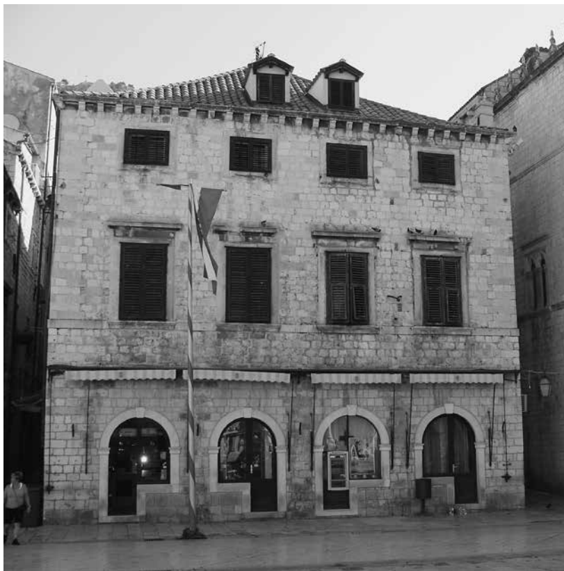
5. Dubrovnik, prva općinska kuća na Placi (lipanj 2013.) / Dubrovnik, the first Communal House on Placa (June 2013)

smještene zapadno od Sponze. Ona je u to vrijeme služila kao privremena rezidencija dubrovačkih nadbiskupa, jer je stara nadbiskupska palača izgrađena u vrijeme nadbiskupa Ilije Sarake stradala u velikom potresu. 48 Podignuta planski odmah nakon potresa, prva općinska kuća na Placi izgrađena je prema projektu domaćih graditelja, providnika grada iz 1668. godine, nakon što je odbačen prvi projekt rimskog arhitekta Giulija Cerruttija. 49 Po dovršetku izgradnje 1670. godine ulazi u ponovno uspostavljeni sustav najmova struktura u državnom vlasništvu, 50 da bi se 1691. godine počela uređivati za boravak nadbiskupa – Giovannija Vincenza Lucchesinija. Od 7. prosinca 1691. godine nadalje kao mjesto sastavljanja dokumenata redovito se navodi nadbiskupska palača («Dal nostro Palazzo Arcivescovile»), 51 za razliku od rezidencije («Dalla nostra Residenza») kako stoji u starijim dokumentima, iz čega je razvidno da je prva općinska kuća službeno preuzela funkciju nadbiskupske palače krajem 1691. godine, odnosno da je u tom trenutku već bila uređena za stanovanje nadbiskupa. Za uređenje te privremene nadbiskupove rezidencije, koja je tu funkciju zadržala do dovršetka preuređenja palače Ranjina južno od katedrale 1718. godine, osim znatnih sredstava koje je utrošila država, nadbiskup Lucchesini je sam financirao vrlo zahtjevne zahvate. U već spomenutom dokumentu iz 1693. godine o