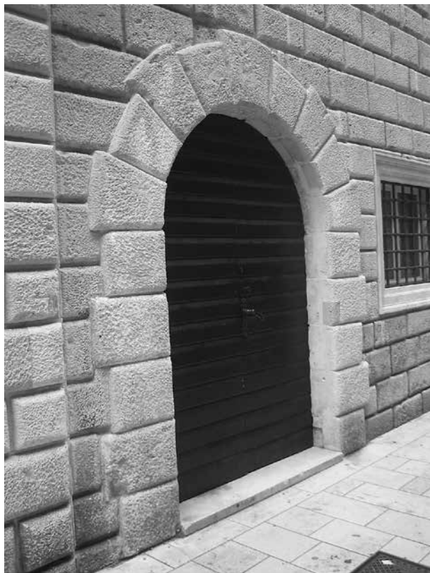
4. Dubrovnik, portal sjevernog pročelja palače Sorkočević, lipanj 2013. / Dubrovnik, portal of the Sorkočević palace north front, June 2013

trašnjiosti uz starija, gotička i renesansna obilježja, prisutna i ona barokna): 34 u obje je građevine riječ o intervencijama u raniju strukturu, s naglašenom svijesti o već prisutnim stilskim oblicima prethodnih razdoblja, a koje su novi zahvati očito imali namjeru poštovati. Takav odnos prema zatečenom i naslijeđenom stanju građevine razumljiv je kod školovanog arhitekta Napolijeva profila koji je svoje poznavanje suvremenoga arhitektonskog izraza iskazao na zahvatima s jasnim baroknim obilježjima – ovalnoj kapeli Kneževa dvora 35 i novoj baroknoj katedrali. 36 Premda pisani izvori izrijeком ne spominju ime Tommasa Napolija u građevinskim intervencijama na nadbiskupskim posjedima, točnije na obnovi ljetnikovca na Šipanu i njegova nova bagnato portala, primjena srodnih, anakronih oblika u istome povijesnom trenutku (u posljednjem desetljeću 17. stoljeća), kao i načela poštivanja prijašnje strukture drugačijih stilskih obilježja nagoviješta mogućnost Napolijeve intervencije u obnovi ljetnikovca na Šipanu. Tomu u prilog govori i činjenica da su tijekom Napolijeva višegodišnjeg boravka u Dubrovniku za sada arhivski potvrđena samo tri djela (obnove Kneževa dvora i Sorkočevićeve palače te značajna dionica izgradnje barokne katedrale), što se objašnjava njegovim stalnim angažmanom i redovitim приходima u službi Dubrovačke Republike. 37