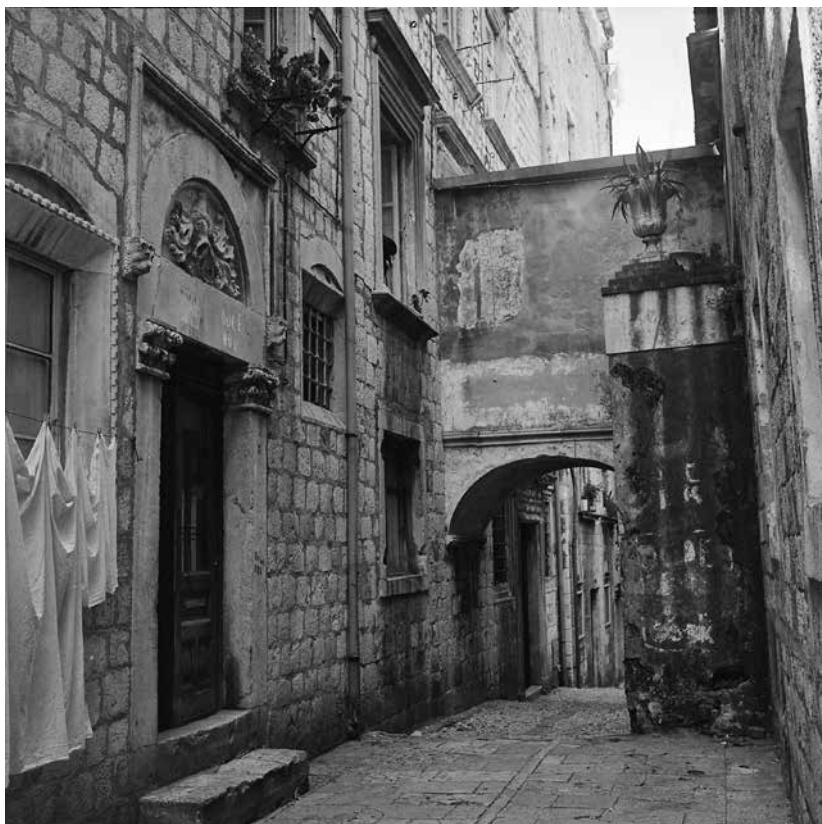
8. Dubrovnik, most u Ulici braće Andrijića 8, Fototeka Instituta za povijest umjetnosti, neg. 2N-8978 (foto: K. Tadić, 1969.) / Dubrovnik, the bridge in no. 8, Brothers Andrijić street, Institute of Art History, Photo Collection, neg. 2N-8978

kata jedina prostorija u perimetru prve općinske kuće (dakle poveziva mostom) bila ona sjeverno od nekadašnjeg stubišta.