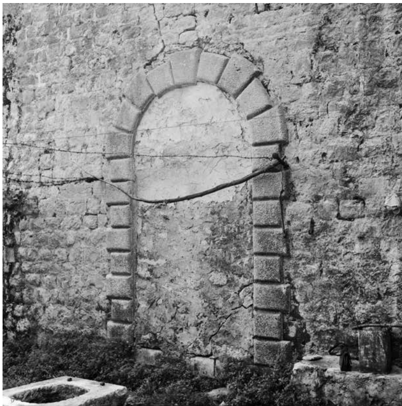
3. Portal zapadnog pročelja sjevernog krila nadbiskupskog ljetnikovca na Šipanu, Fototeka Instituta za povijest umjetnosti, neg. 2N-10675 (foto: K. Tadić, 1969.) / Portal of the west front of the north wing of the Archbishop's villa on Šipan, Photo collection of the Institute of Art History, neg. 2N-10675

unutarnje uređenje sa zidnim oslikom salona ljetnikovca koji je u obliku friza pod nekadašnjim tabulatom izveo talijanski slikar Pellegrino Brocardo (Pigna, Ligurija, ? – Genova/Ventimiglia, 1590.). 24 Premda su se nadbiskupskim ljetnikovcem na Šipanu povremeno koristili i drugi nadbiskupi nakon Lodovica Beccadellija, 25 na njemu vjerojatno nije bilo većih obnova, a lošem stanju u kojem ga je nadbiskup Lucchesini zatekao 1690. godine doprinijela je činjenica da u njemu nitko nije boravio od potresa 1667. godine. 26 U svrhu obnove posjeda i vile na Šipanu Republika je nadbiskupu odmah po njegovu dolasku dodijelila iznos od šest stotina dukata, 27 da bi na obnovu šipanskog posjeda u konačnici utrošila ukupno sedam stotina. 28 U prostorijama ljetnikovca Lucchesini je dao postaviti nove zastore te obnoviti stropove, od kojih su neki bili urušeni, a nekima je prijetilo rušenje; zamijenjene su trule nosive grede i napravljeni novi prozorski kapci, dao je popraviti krov koji je bio gotovo potpuno otkriven, te izraditi novi portal, odakle se novim stubištem trebalo uspinjati u ljetnikovac. Dao je popraviti i kapelu 29 koja nije imala strop i čiji je krov bio u ruševnom stanju. Strop je podignut, popravljeni su oštećeni zidovi, a posebice onaj na strani oltara. Među navedenim popravcima koje je dao izvesti nadbiskup Lucchesini kako