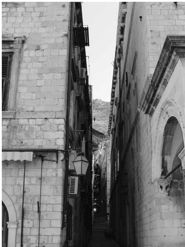
6. Dubrovnik, pogled na Zlatarsku ulicu (lipanj 2013.) / Dubrovnik, view of Zlatarska ulica (Goldsmiths' street) (June 2013)

strukture koja je između 1691. i 1720. godine premošćivala Zlatarsku ulicu moguće je pretpostaviti usporedbom rasporeda i smještaja prostorija na prvom katu prve općinske kuće sa zapadne te Sponze s istočne strane ulice. Prvi je kat