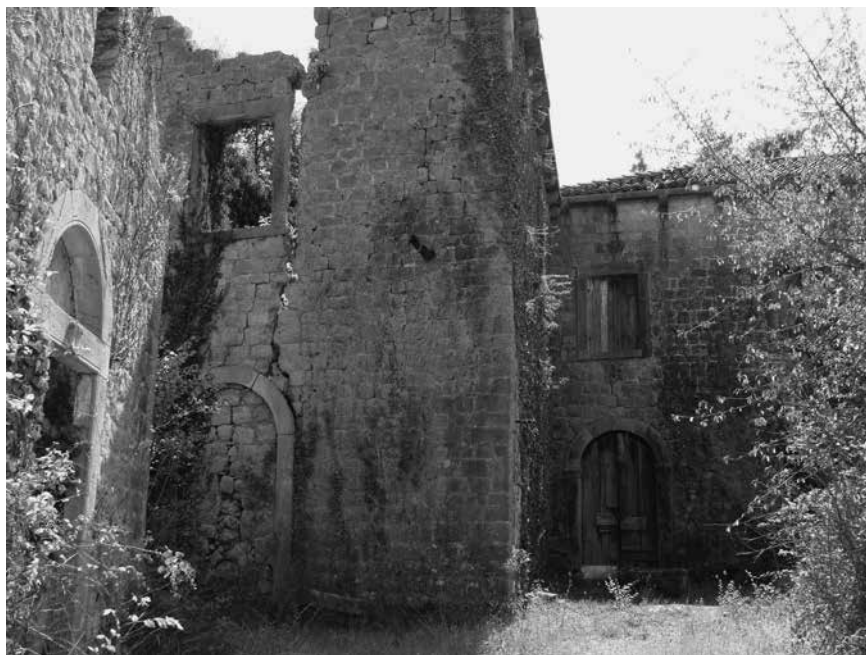
2. Nadbiskupski ljetnikovac na Šipanu, pogled sa sjevera (kolovoz 2012.) / The Archbishop's villa on the island Šipan, view from the north (August 2012)

nje 15 – pohranio u dubrovački samostan klarisa gdje mu je, prema Farlatiju, dao podići oltar, 16 a tek ga je poslije Vlada dala prenijeti u riznicu katedrale. 17 Uslijedilo je uvođenje sv. Filipa Benizija kao sveca zagovornika Dubrovačke Republike, komu se – uz bok zaštitniku sv. Vlahu – pobožnost iskazivala i tijekom epidemije kuge koja je u Gradu otkrivena 9. siječnja 1691. godine. 18