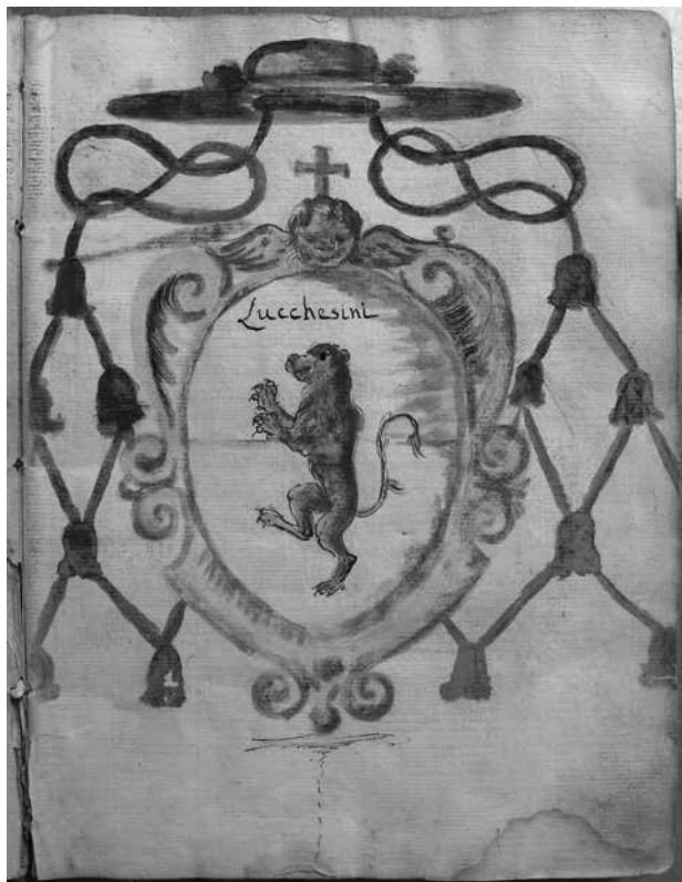
1. Grb nadbiskupa Giovannija Vincenza Lucchesinija na predlistu knjige raznih spisa nadbiskupske kurije (ABD, Diversa 7) / The coat of arms of Archbishop Giovanni Vincenzo Lucchesini on the first folio containing various documents in the Archbishop's curia (ABD, Diversa 7)

(čemu je prethodio doček predstavnika Republike u Gružu te boravak u nekadašnjem benediktinskom samostanu sv. Jakova na Višnjici), postala je uzor za dočeke svih nadbiskupa nakon njega. 11 Giovanni Vincenzo Lucchesini posebno je promicao čašćenje sv. Filipa Benizija, potaknuto ponovljenim čudom svečeve slike na dan nadbiskupova svečana ulaska u Grad, 12 ali i ozdravljenjima redovnica iz samostana sv. Klare i uslišanim molitvama upućenima tomu svecu. 13 Relikvijar s čudotvornom svečevom slikom nadbiskup je donio u Dubrovnik prilikom dolaska u grad 14 te ga – uz precizne upute za njegovo čuva-