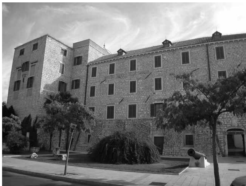
4. Šibenik, pogled na južno pročelje Kneževе palače, 2010. / Šibenik, view of the south front of The Rector's Palace, 2010

Osim vrsno klesanih romaničkih bifora na južnom krilu rapske kneževе palače koje su rastvarale zid svećane dvorane u prvom katu i romaničko-gotičkog portala kule, 26 na istoj palači javlja se i vrlo zanimljivo oblikovanje kamenog balkona. Taj balkon nalazi se nad portalom istočnog krila i