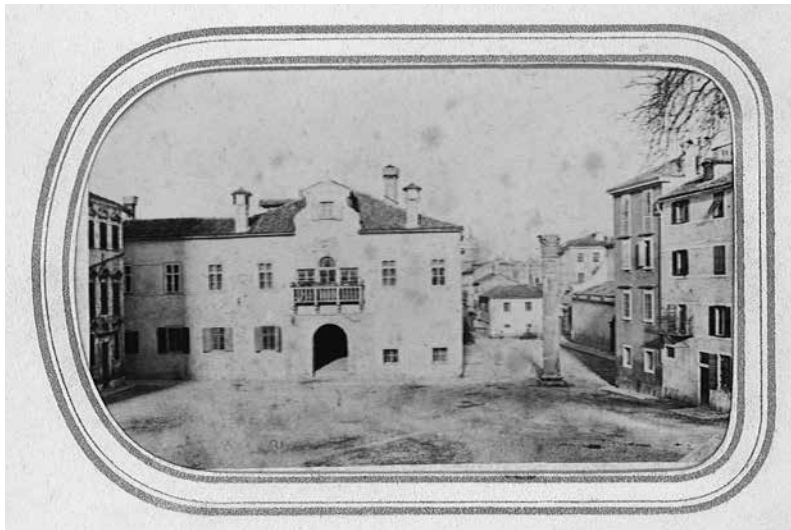
2. Fotografija baroknog pročelja providurove palače u Zadru / Photo of Baroque front of The Rector's Palace in Zadar

O rasporedu prostorija u šibenskoj kneževoj palači najviše pak saznajemo iz njezina opisa u Generalnom katastru 19 koji je sastavio mletački javni inženjer Gian Nicolò Nachich i nacrt 20 koje je desetak godina prije, 1788. godine, napravio inženjer F. Zavoreo. U prizemlju istočnog krila bile su prostorije gospodarske namjene, sa zasebnim ulazom iz ulice koja vodi kroz gradska vrata Porta del Palazzo . Na katu istočnog krila također su bile prostorije uporabnih funkcija: kuhinja, ostava i spremište, a do