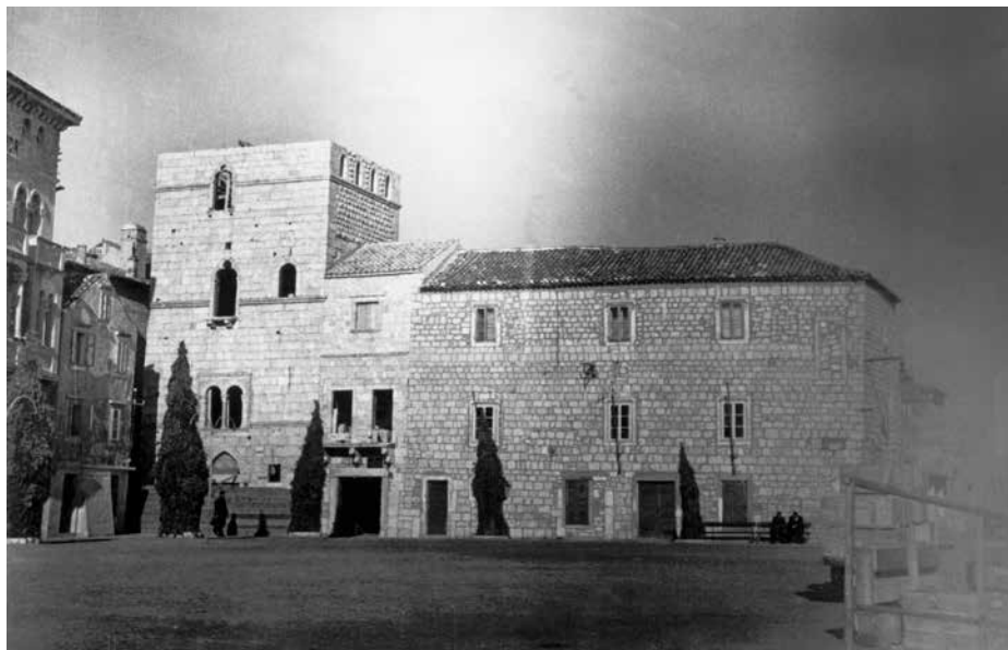
1. Rab, kneževa palača, Fotodokumentacija Konzervatorskog zavoda u Rijeci (foto: Šerak, 1954.) / The Rector's Palace, Rab, Rijeka Conservation Office, 1954

hijerarhija upravno-vojne podjele što je zapravo pridonijelo neučinkovitom načinu odlučivanja i kočilo gotovo ikakav razvoj lokalnih upravnih centara, podređenih pokrajinskoj centralnoj vlasti u Zadru, i stagnacijom koja je proizašla dijelom iz prekida daljnjega teritorijalnog širenja mletačkih područja, potom zbog sve lošijega gospodarskog stanja u državi, a time i slabljenja mletačkoga političkog utjecaja u tadašnja događanja u Europi.