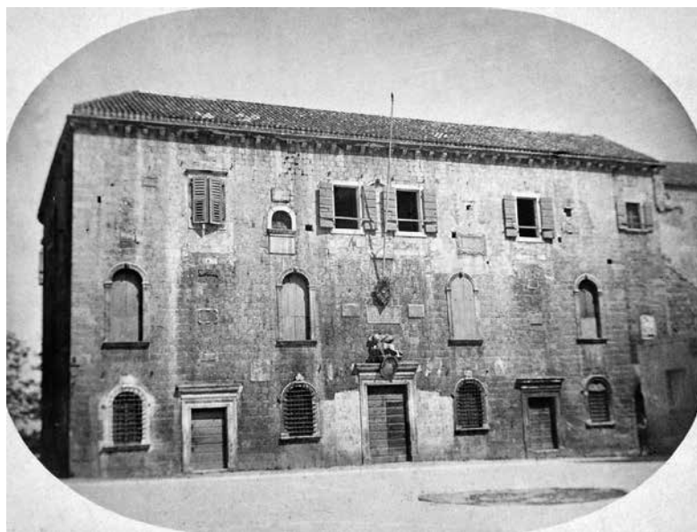
5. Fotografija trogirske kneževе palače, 19. stoljeće, Muzej grada Trogira / Photo of The Rector's Palace in Trogir, in the 19th c, Trogir Municipal Museum

U vrijeme mletačke uprave glavno pročelje trogirske palače imalo je drugačiju ritmičku podjelu otvora prizemlja, prvog i drugog kata od one današnje (sl. 5). U prizemlju su bili polukružni prozori koji se datiraju na prijelaz iz 15. u 16. stoljeće i pripisuju radionici Nikole Firentinca, 24 na prvom su katu bili izduženiji prozori s kamenim glavama koje je izgledno radio Trifun Bokanić, 25 dok su na dru-