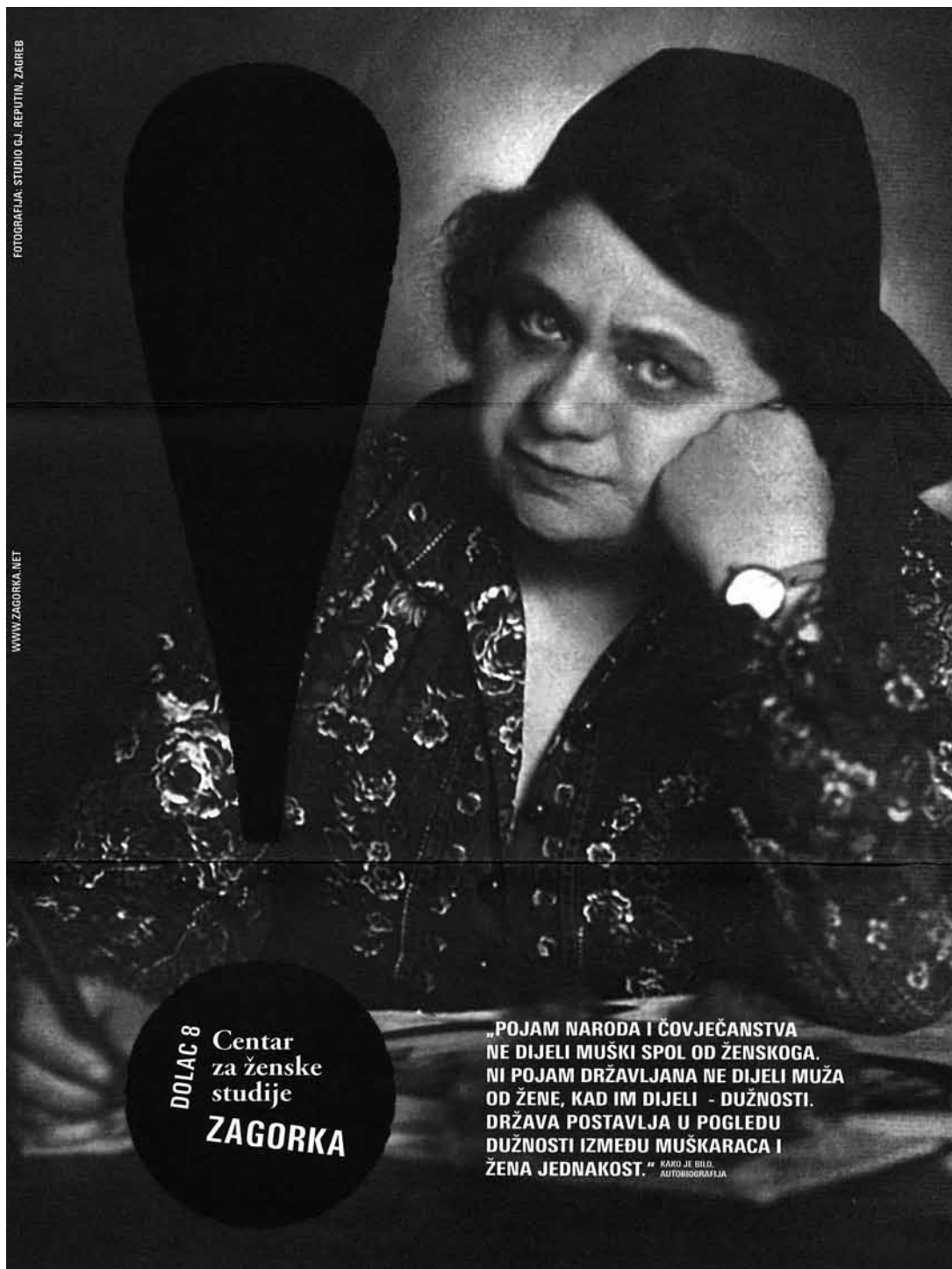
sl.1. Informativni letak Centra za ženske studije koji je smješten na istoj adresi kao i Memorijalni stan Marije Jurić Zagorke.

Svi spomenuti elementi tih dviju skupina identiteta činit će priču o Zagorki koja će biti prezentirana u memorijalnoj sobi (soba u kojoj su i do sada bili prezentirani predmeti iz Zagorkina života). Detaljnija objašnjenja tlocrta stana nalaze se u poglavlju 3.1.