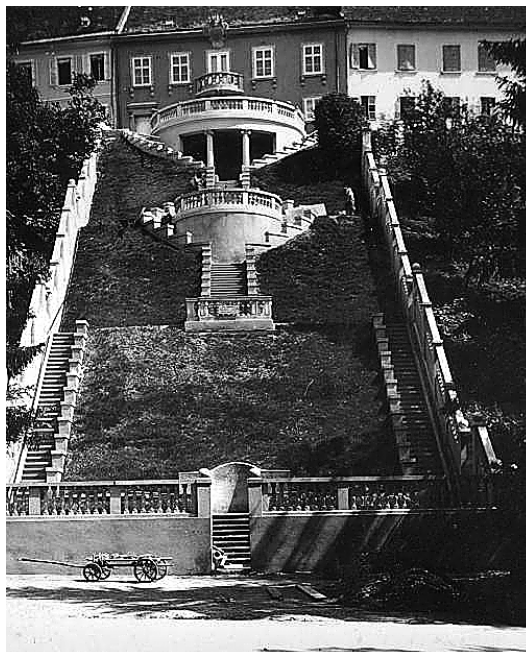
sl.19. Vrt palače Babočaj-Gvozdanović, fotografija iz ranih 1930-ih.

Zbirka Margite i Rudolfa Matza u Mesničkoj 15, koja je, za razliku od ostalih, izravno darovana Muzeju grada Zagreba. Prvih je pet spomenutih zbirki otvoreno, dok su dvije posljednje zbog radova na obnovi i uređenju još uvijek zatvorene za javnost.