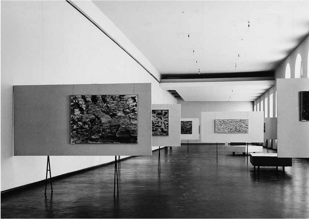
sl.14. Postav izložbe Gromače Otona Glihe u novom prostoru Galerije likovnih umjetnosti na Dolcu, zgrada Sveučilišne knjižnice, Rijeka, 2.-29. lipnja 1958.

zbirci dokumentacije koja se sustavno skuplja i čuva te predstavlja duh vremena i čini važnu kronološku arhivu razvoja djelatnosti i programske okosnice ustanove unutar formalne kulturne politike. Postavljajući se danas u odnosu prema tadašnjoj galerijskoj praksi, ali i suvremenim trendovima, popularno ili stručno, iščitavamo da je riječ o građi koja u svakom trenutku daje sliku o istinitosti i važnosti, o različitim zgodama i nezgodama, o legendama, ljubavi i mržnji, o nesnošljivosti i simpatijama, podobnosti i nepodobnosti te svim materijalnim, vidljivim činjenicama dokumentacije.