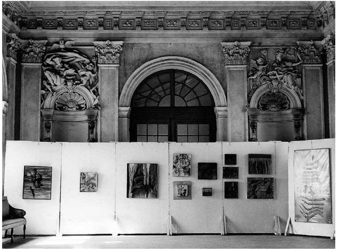
sl.13. Najava programa riječke Galerije likovnih umjetnosti, Globus , veljača, 1958.