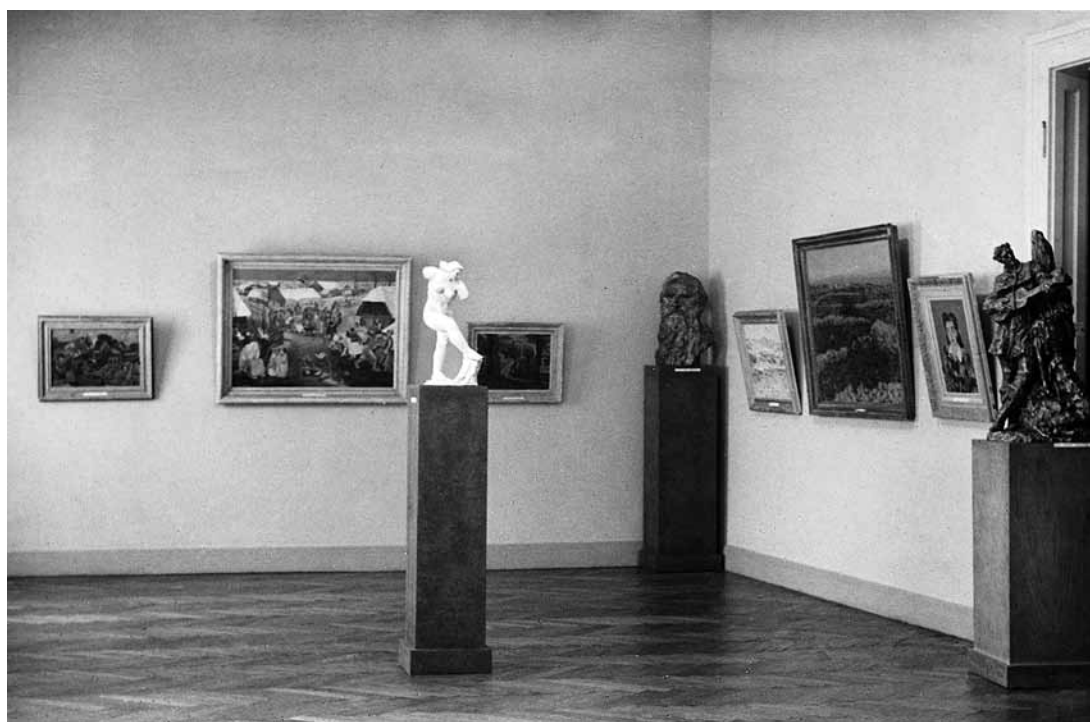
sl. 1. Dvorana 20. stoljeća, stalni postav Galerije likovnih umjetnosti, Dom kulture Vladimir Švalba Vid, Rijeka, 1951.