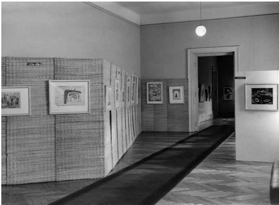
sl.9. Postav Međunarodne izložbe drvoreza u boji , Galerija likovnih umjetnosti na Zgrada Narodnog muzeja, Rijeka, 9.-31. srpnja 1955.