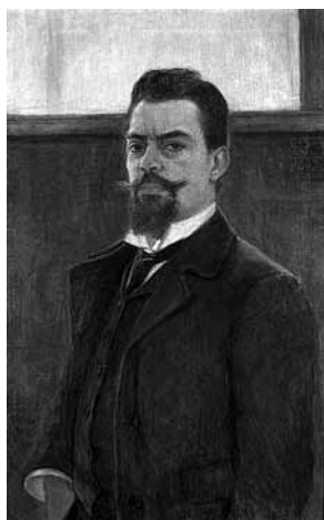
sl.4. Autoportret, 1903.

Slijedom kretanja, kao kontrast literarnim, povijesnim i mističnim motivima po kojima je Csikos bio najpoznatiji, predstavljeno je dvanaest eksplicitno nacrtanih erotskih crteža s parovima u različitim pozama, vidljivih samo kroz uski prorez u montažnom zidu. Ti su crteži zbog