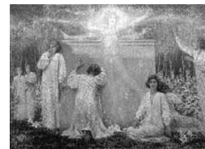
sl.3. Inocencija , 1927.