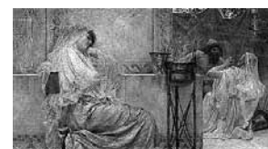
sl.1. Studija za sliku Mrtva straža , 1896.

IM 43 (1-4) 2012. IZ MUZEJSKE TEORIJE I PRAKSE MUSEUM THEORY AND PRACTICE