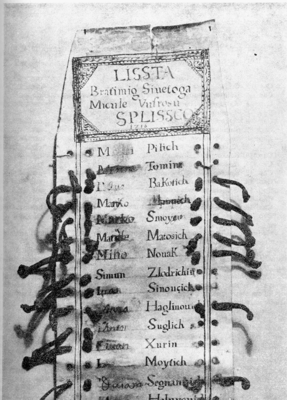
Lista (popis, oputa) bratima bratovštine svetoga Nikole u Splitu