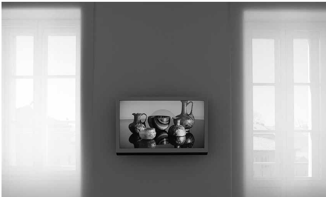
sl.4. Film Staklo u kućanstvu / Household Glass

nja groba, crtanja po fazama, otvaranja kamenih urni te vađenje grobnih priloga i njihovo pohranjivanje. Osim prikaza tipologije ukopa, lijepo je vidljiva i sva raznolikost grobnih priloga, ponajprije staklenih i keramičkih. 16