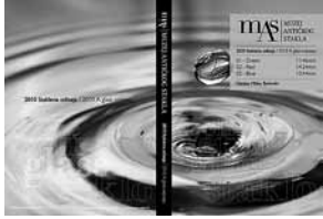
sl.2. Omot DVD-a za film Antička nekropola Zadar / The Ancient Necropolis Zadar .