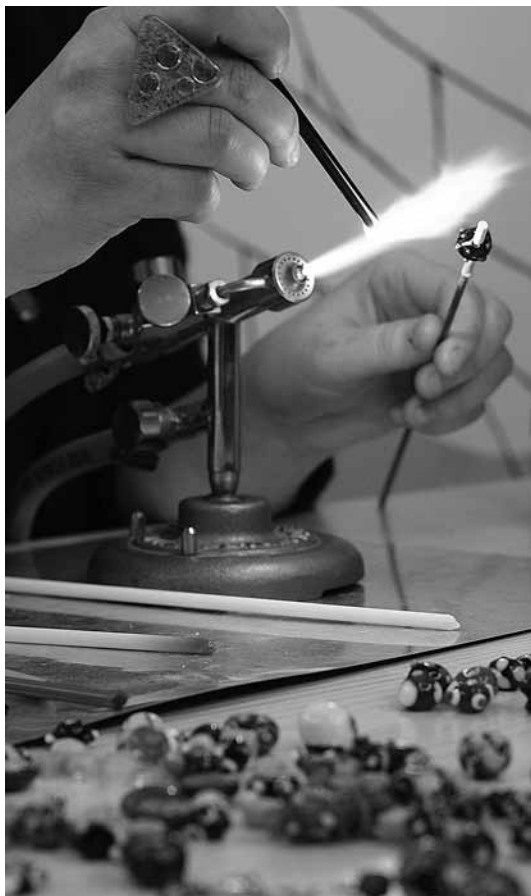
sl.5. Demonstracija izrade staklenih perli na plameniku