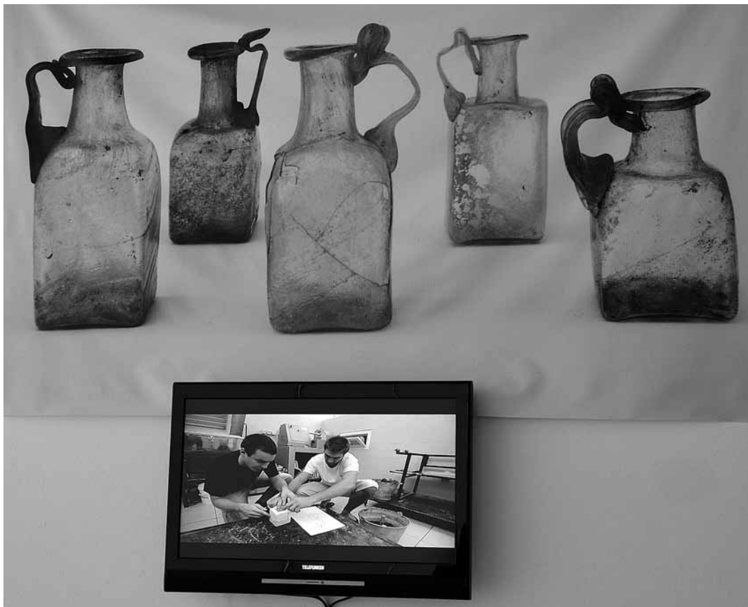
sl.7. Projekcija filma Izrada reljefnog žiga / Making the Relief Stamp na izložbi Rimsko staklo Hrvatske / Radionički reljefni žigovi

gira promatrača kao aktivnog sudionika tog putovanja kroz prebogati opus te iznimne umjetnice.