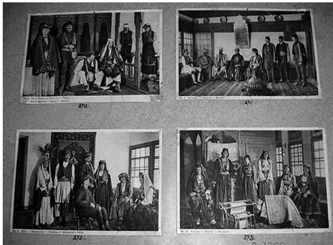
sl.1. Fotografije izložaba koje su se održavale u razdoblju od 1913. - 1949.

zbirke EO-a. Počeo je prikupljati narodne nošnje. S tim ciljem organizirao je namjenska terenska istraživanja u srednjoj Bosni, južnoj Hercegovini te u travničkome, banjalučkome i mostarskom okrugu. Tako se njegovom zaslugom u zbirci EO-a našao vrlo lijep broj kompleta nošnji kako iz različitih krajeva BiH, tako i svih konfesija. Uz komplete nošnji nabavljani su i pojedinačni dijelovi koji danas čine impozantan fond na osnovi kojega se može proučavati kulturno-povijesni razvoj nošnji u BiH u 19. st. Samo četiri godine nakon osnivanja Muzeja Odjeljenje je posjedovalo zbirku od 75 kompleta nošnji i 50 kostima (dijelovi nošnji imućnih feudalaca i građana). Zbirka etnografskog materijala postupno se povećavala, pa se tada, osim nošnji, nabavlja i nakit kao proizvod nadaleko poznatih bosanskohercegovačkih obrtnika - kujundžija . Nabavljaju se proizvodi i drugih obrtnika: kazandžija , drvorezaca, terzija (krojača), sarača (remenara), kovača, abadžija (suknara) i drugih koji danas čine zbirku gradskog pokućstva i obrta.