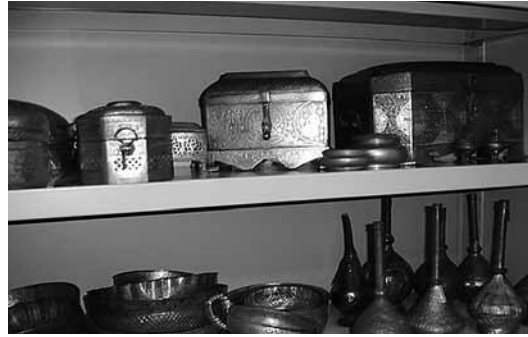
sl.8. Zbirka đulevdana, hamam tasova i kutija

Od 1972. g. u Odjeljenju se osniva služba za dokumentaciju i otada ona postaje stjecište svih dokumenata vezanih za obradu predmeta. Sveobuhvatno se uspostavlja sustav inventara i kartoteka, redosljed kreiranja i obrade predmeta - od ulaska predmeta u Muzej do smještaja u zbirke, izrađuju se odjelne i priručne kartoteke predmeta i zapisa, radi se kompletna evidencija fototeke, kao i transkribiranje zapisa s magnetofonskih vrpca, obrada filmskog materijala, uspostavlja se audiovizualna dokumentacija i dr. Tim se načinom obrađuju ne samo novonabavljeni predmeti već i stari fond predmeta koji je do 1988. g., tj. u 100-godišnjoj praksi Muzeja, reinventarizacijom u 90%-tnom opsegu preveden u novi sustav. U postdejtonskom razdoblju intenzivno se radi na reviziji kompletne dokumentacije, uvođenju kompjutorskih podataka i fotografiranju svih predmeta, posebno nakon povratka dokumentarista sa studijskog boravka u Zagrebu.