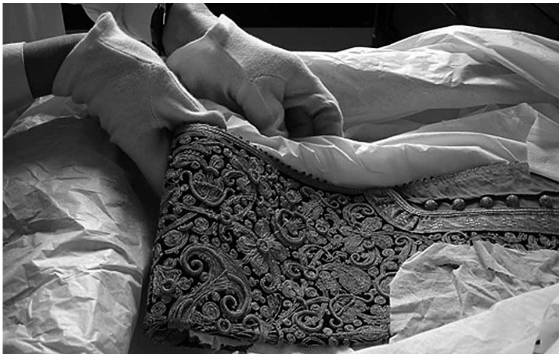
sl.3. Zbirka čevkena

Zbirke, razvrstane prema vrstama materijala i tematskom sadržaju (gospodarstvo, seosko i gradsko pukuštvo, gradska i seoska nošnja, pojedinačni dijelovi nošnje, obrti, nakit, glazbeni instrumenti, makete, običaji i vjerovanja, narodna medicina, dječje igračke, uzorci veza, oružje, pribor za pušenje i dr.), u sklopu kojih je primijenjen sustav regionalne sistematizacije, a u ponekih i tipološke ili nacionalne (nošnje) do 1992. g. narasle su do 15 599 predmeta. Tom broju treba dodati ilustrativni materijal (negative, foto-ploče, fotografije, slike, crteže), arhivsku građu i druge vrste dokumentacijskog materijala, koji je ponovno, drugi put u istom stoljeću, bio izložen ratnoj opasnosti od fizičkog oštećenja i uništenja. Stoga su od sredine lipnja 1992. g. poduzete hitne mjere spašavanja najvrednijih predmeta, koji su premješteni u trezor banke, a ostale zbirke sa svih izložbi (koje su demontirane) više su puta tijekom rata preseljavane, uz strogu evidenciju s popisima, u sigurnije prostore Muzeja. Gotovo se istodobno radilo i na zaštiti materijala, istina, u otežanim uvjetima i bez odgovarajuće ambalaže i potrebnih sredstava. Možda je suviše naglašavati, ali sve su aktivnosti obavljane u apsolutno neciviliziranim uvjetima života, s desetkovanim osobljem koje je u opkoljenom gradu, zajedno sa svim stanovnicima, bilo svakodnevno izloženo životnim opasnostima. Svojevrsnom "ruskom ruletu" nadomak linije razdvajanja dvaju frontova.