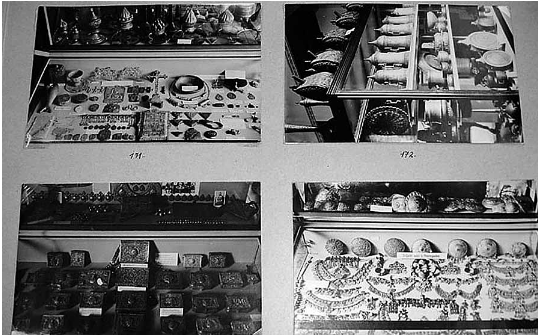
sl.2. Fotografije nakita iz fundusa muzeja

Za vrijeme Prvoga svjetskog rata fond predmeta nije se povećavao, a zbirke Odjeljenja sačuvane su u cjelini. Iako se za sadržaj zbirke u prvoj fazi razvoja Odjeljenja (za vrijeme austrougarske uprave) ne može reći da su ga nabavljali stručnjaci - etnolozi, mora se istaknuti da su svi predmeti koji su uvršteni u zbirke uglavnom reprezentativni. Strancima su dočaravali "egzotiku Bosne", a stvarno su ne samo obogaćivali fond, nego su odonda do danas bili osnova za proširivanje i kompletiranje zbirke, njihovo proučavanje i rasvjetljavanje kulturno-povijesnog naslijeđa svih naroda u BiH.