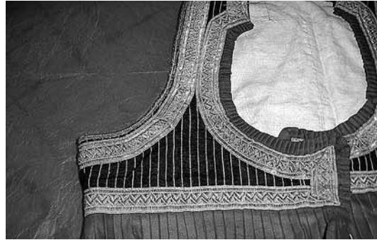
sl.4 Zbirka pojaseva