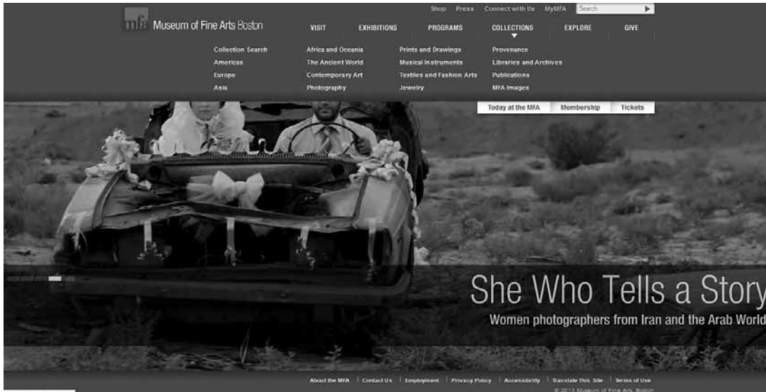
sl.2. Museum of Fine Arts Boston: na mrežnoj stranici u kategoriji 'Collection' pojavljuje se podkategorija 'Provenance'.