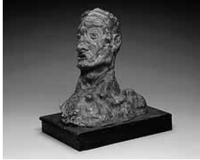
sl.3. Autoportret kao ratnika, Oskar Kokoschka, 1909.