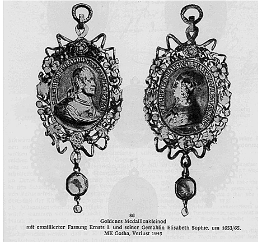
66 Goldenes Medallienkleinod mit emailierter Fassung Ernsts I. und seiner Gemahlin Elisabeth Sophie, um 1653/65. MK Gotha, Verlust 1949

Na godišnjem Europskom sajmu lijepih umjetnosti (TEFAF) u Maastrichtu, 2011. godine se pojavio rijedan primjerak dvostranog Gnadenpfenniga privjeska iz 17. st. za koji se iz aukcijskih kataloga saznalo da je bio u vlasništvu Schlossmuseuma u Gothi (pokrajina Saksonija) te se smatrao nestalim u razdoblju II. svjetskog rata.