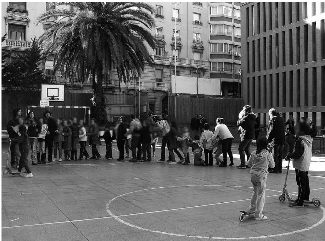
sl.2. Jedna od aktivnosti programa Vrijeme u četvrti, zajedničko obrazovno vrijeme

nja, međuovisnost, proaktivnost, perspektiva, pluralitet i integritet osnovna su načela kojima se vodi taj program.