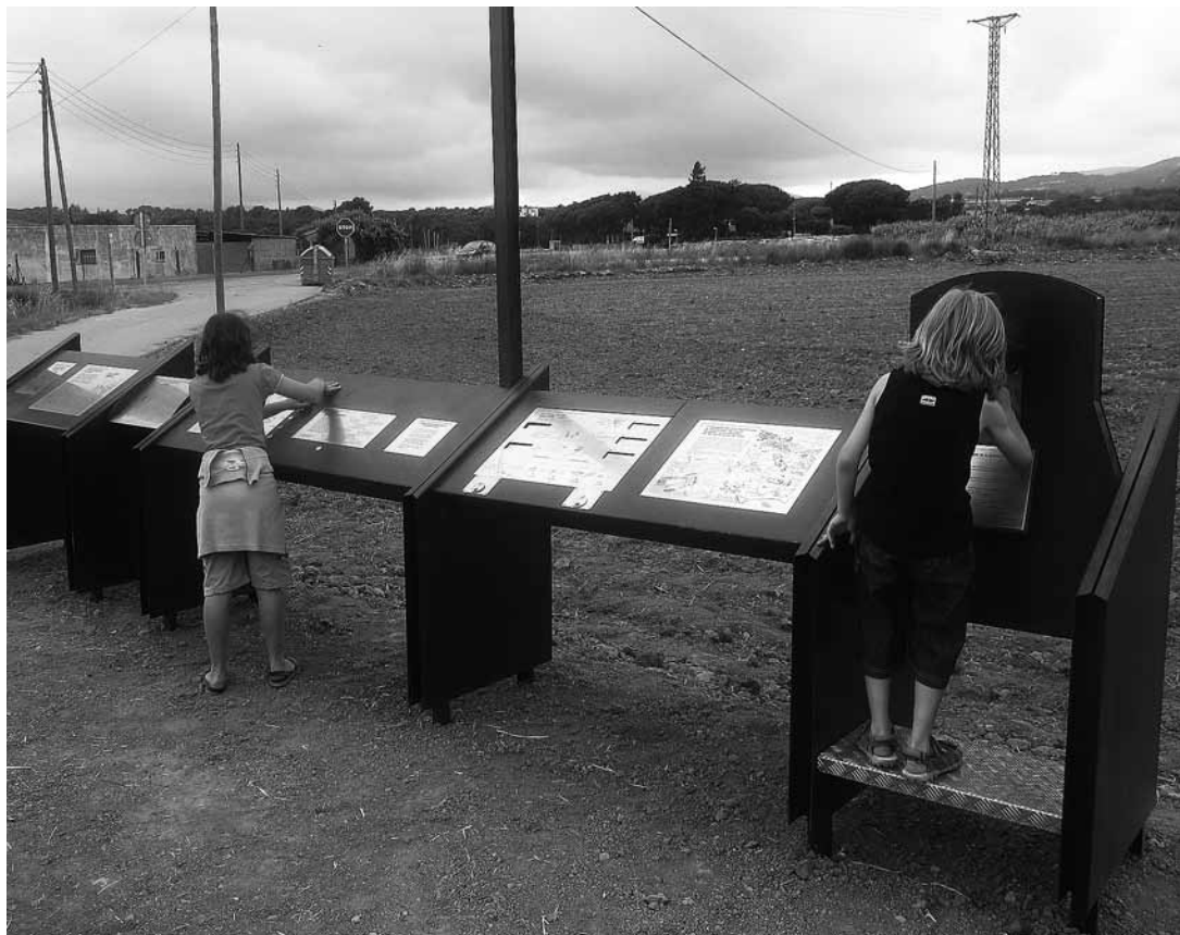
sl.4. Interpretacija na aerodromu Rosanes – detalj