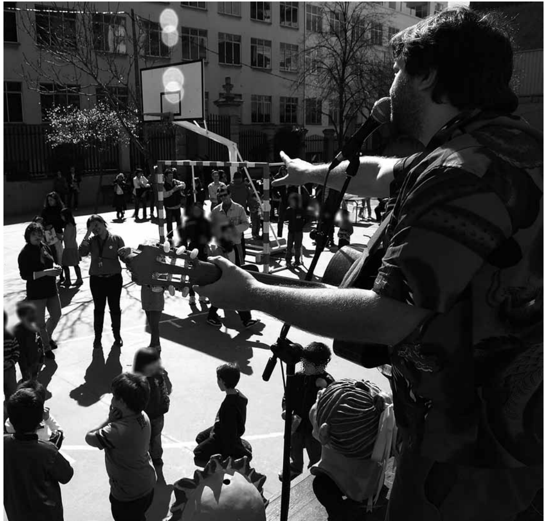
sl.1. Jedna od aktivnosti programa Vrijeme u četvrti, zajedničko obrazovno vrijeme

samoćom, koji su obilježja globalizacije i koji su zavladaali društvima velikih modernih gradova. Postavljeni je cilj bio zaustaviti ove tendencije projektom koji podrazumijeva ljubazniji, bliži i ljudskiji suživot predočen putem vrijednosti suživota u četvrti i u kojemu aktivno i angažirano sudjeluje široka mreža edukacijskih i društvenih aktera koji djeluju za dobrobit gradskog obrazovanja.