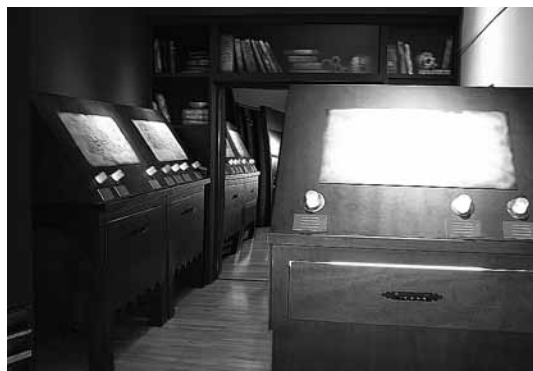
sl.4. Prostor u kojemu se nalazi srednjovjekovni skriptorij s interaktivnim muzeografskim sadržajima.

Nakon toga se stiže do poznatog interaktivnog srednjovjekovnog skriptorija. U tom dijelu koji nosi naziv Devet živih kamena posjetitelji otkrivaju osebnosti devet hramova te doline tijekom tri ključne faze: gradnje, otkrivanja te restauracije. Za tu se svrhu rabe sva sredstva