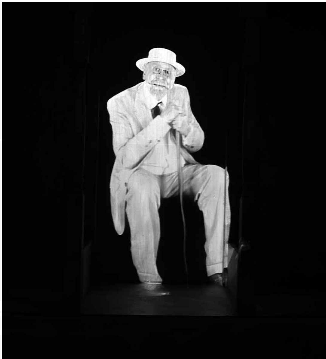
sl.3. Virtualna figura koja predstavlja Puig i Cadafalcha, istaknutu osobu u obnovi romaničkih ostataka u dolini Boi.