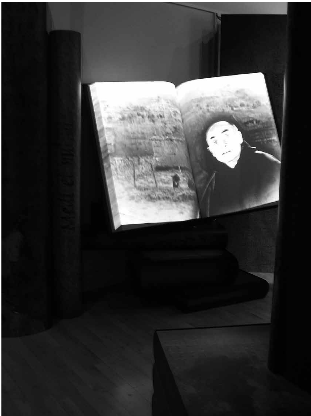
sl.2. Primjer muzeografskog pomagala u obliku divovske kronike koja govori.

ra romanike. Presentacija se aktivira s pulta, a moguć je odabir između četiri jezika: engleskoga, francuskoga, španjolskoga i katalonskoga. Dvorana može primiti 50 osoba, a posjetitelja se iznenađuje elementima koji su skriveni i koji se, zahvaljujući promjenama intenziteta svjetlosti, čine poput priviđenja.