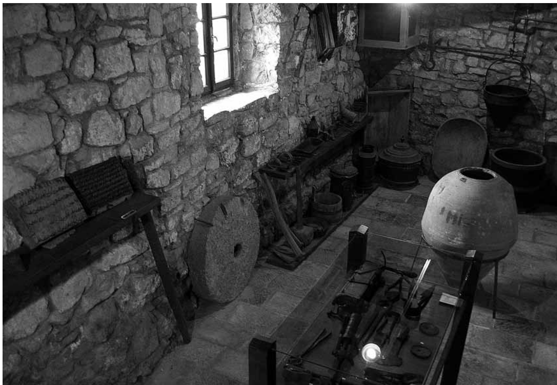
sl.11. Stalni postav Muzej otoka Brača: etnografska zbirka

joj uvelike pomaže ravnateljica Centra za kulturu Brač. Naime, uz posao kustosice, autorica obavlja i dužnost muzejskog vodiča, pedagoginje i blagajnice ove izuzetno posjećene muzejske ustanove.