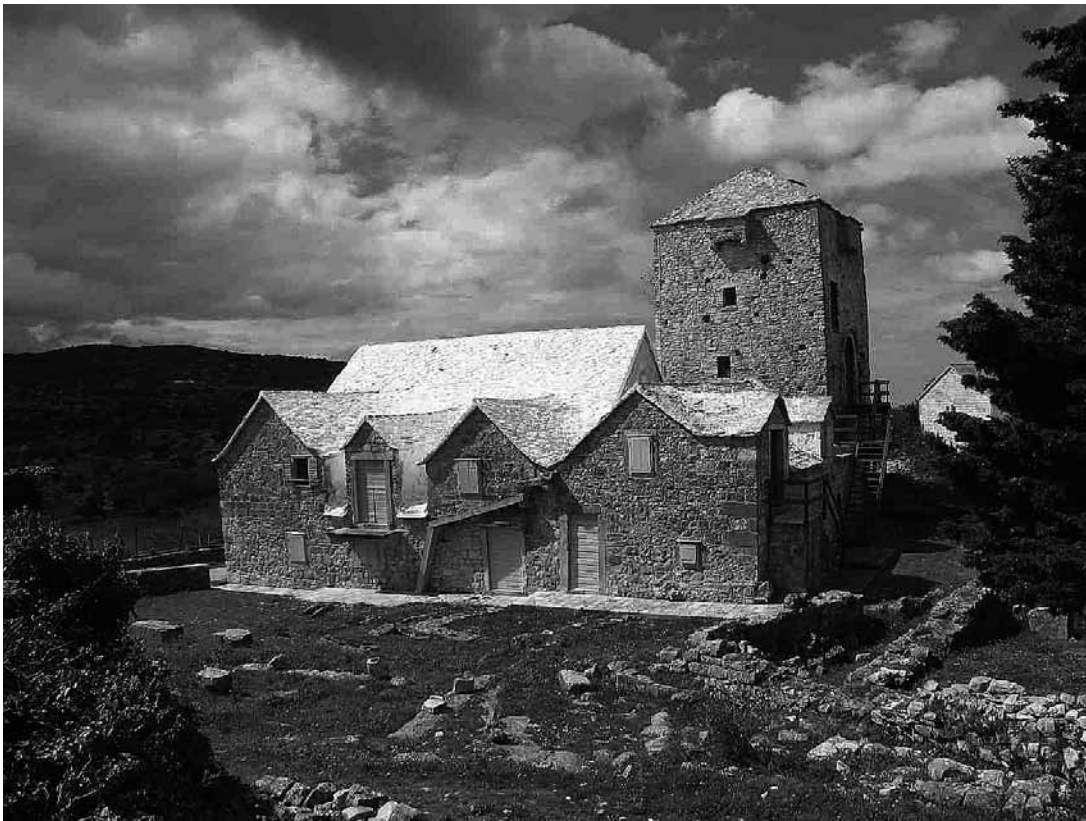
sl.1. Muzej otoka Brača u Škripu

IM 42 (1-4) 2011. RIJEČ JE O... MAIN FEATURE