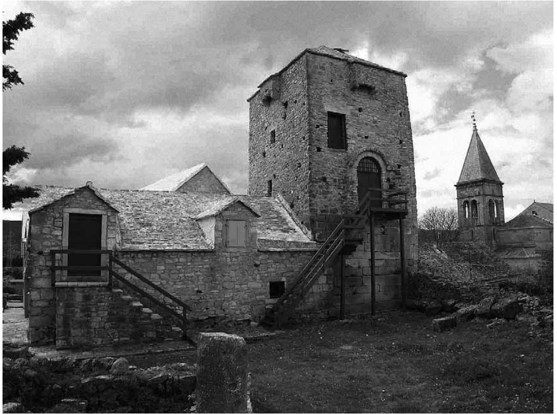
sl.4. Muzej otoka Brača u Škripu: pogled na stražnju stranu i kulu Radojković, koja je obnovljena i dovršena u 16.st.