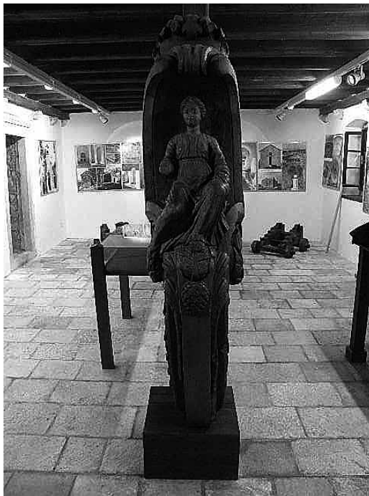
sl.5. Pulena s blatačke polake "Lijepa putnica".

prevladava arheološka građa, smještena u prizemlju zgrade, u prostoriji s lijeve strane ulaza u Muzej. Obilazak Muzeja provodi se kronološkim slijedom.