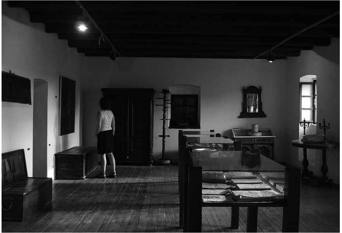
sl.10. Stalni postav Muzej otoka Brača: kulturno-povijesna zbirka

sudionici stručnih ekskurzija, kongresa i manifestacija, poput međunarodne kulinarske manifestacije Biser mora . U vođenju nastojimo biti informativni i zanimljivi jer nam je namjera educirati posjetitelje i istodobno im pružiti kvalitetnu zabavu. Posebna se pozornost pridaje vođenju predškolskih i školskih grupa iz inozemstva i Hrvatske, što se osobito odnosi na najmlađe stanovnike Brača koji se prvi put upoznaju s muzejskom ustanovom i kulturnom baštinom rodnog otoka. Vjerujemo da smo u našim namjerama uspjeli jer smo i ove godine imali više od 12 000 posjetitelja, od kojih se mnogi redovito vraćaju svake godine.