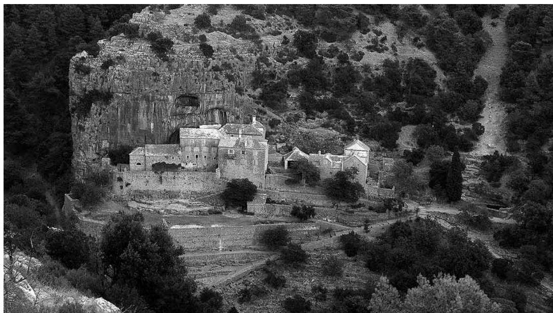
sl.1. Pustinju Blaca utemeljili su poljički svećenici glagoljaši, bježeći od Turaka polovicom 16. st., na južnim obroncima otoka Brača.

JASNA DAMJANOVIĆ □ Centar za kulturu Brač / Muzej i samostan Pustinje Blaca, Nerežišća