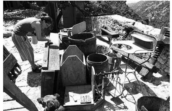
sl.9. Obnovljena blatačka konoba.