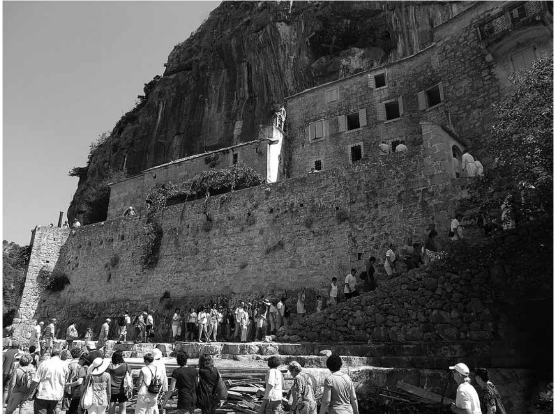
sl.18. Jednom na godinu, prve subote nakon Velike Gospe, u Pustinju dolaze hodočasnici slaveći blagdan Uznesenja Blažene Djevice Marije (Gospe Blatačke).