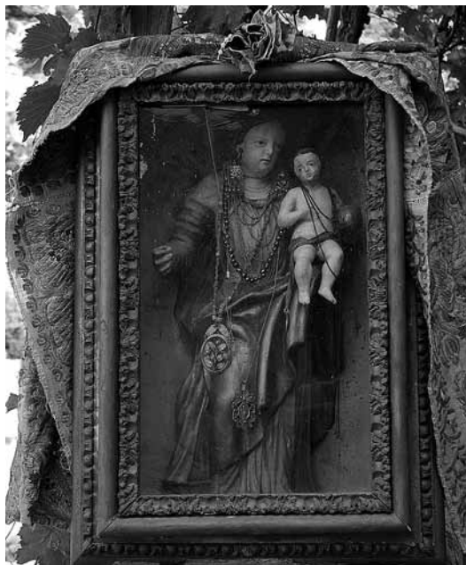
sl.19. Kip Gospe Blatačke, koju su u 16. st. kao simbol vjere i hrvatskog imena sa sobom donijeli poljički glagoljaši bježeći pred Turcima.

Svećenici pustinjaci u Blacima bili su pravi ljubitelji knjige i za svoje su potrebe i buduća vremena nabavljali određenu literaturu. Don Nikola Miličević mlađi izjavio je 1956. g. da bi bez knjiga u Pustinji bilo dosadno, te da samostanska biblioteka posjeduje 3 500 astronomskih knjiga i publikacija, kao i približno 5 000 drugih knjiga koje su nabavljali na različitim putovanjima po Italiji i Austriji. Sredinom 19. st. kupili su od braće don Stipe i don Mije Radovčića, pustinjaka Dračeve luke, cjelokupnu njihovu opsežnu biblioteku koja je, uz ostalo, imala i zavidnu kolekciju talijanskih klasika. U samostanskoj se biblioteci mogu naći knjige s područja astronomije, matematike, fizike, geodezije, klasične književnosti, beletristike, ali i notni zapisi te astronomske i zemljopisne karte. Osobitu vrijednost imaju crkvene knjige iz 17., 18. i 19. st. te blatački arhiv, prema kojemu se mogu rekonstruirati ekonomski i društveni ritmovi te zajednice,