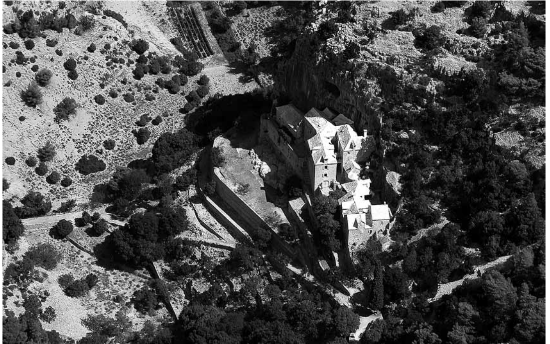
sl.5. Pustinja Blaca, avionski snimak.

i zaljevanje, stakleniku, pčelinjaku, voćnjaku i perivoju, Blaca se zaista doimlju kao sažetak grada u dobrom smislu, zaključuje Tomislav Bužančić koji se bavio arhitekturom i urbanizmom pučkih naselja otoka Brača.