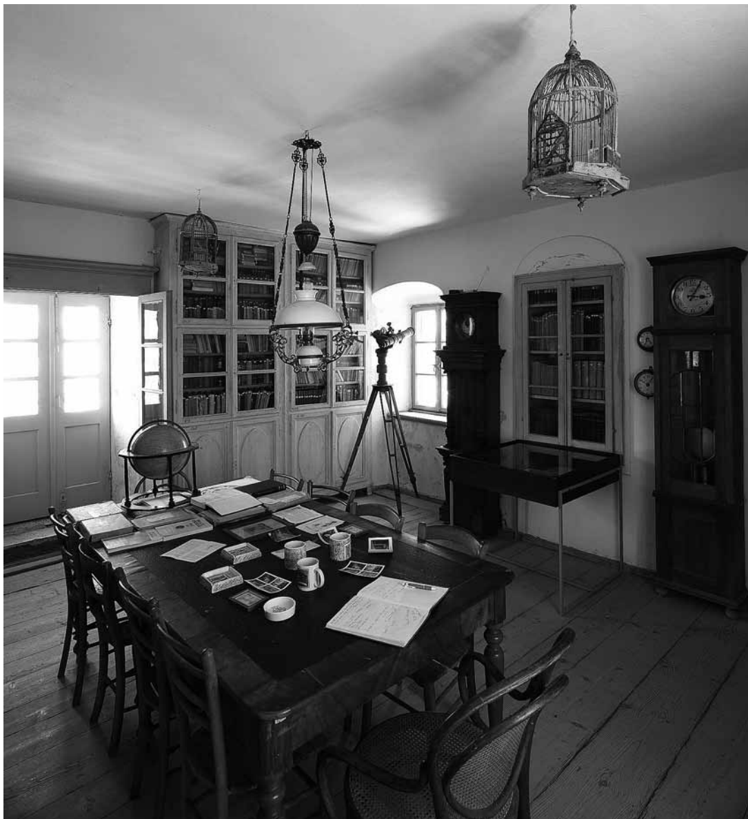
sl.6. Biblioteka, Pustinja Blaca.

dobiti. Sve generacije pustinjaka držale su se Pravilnika koji je govorio o njihovim obvezama, počevši od uzornosti svećenika do nepovredivoga zajedničkog imetka koji je ostajao zajednici.