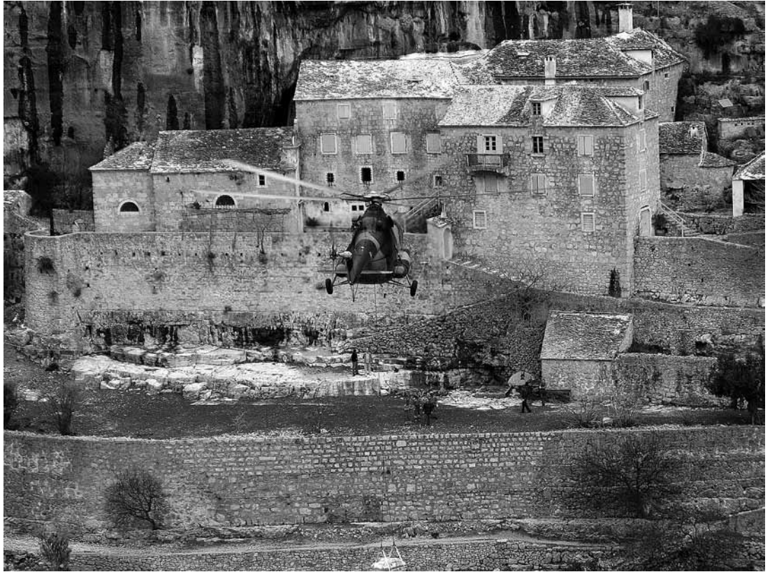
sl.17. Novi, intenzivni radovi na sanaciji započeli u siječnju 2008., kada je u Blaca dopremljen teški građevni materijal zahvaljujući velikoj pomoći Ministarstva obrane RH - pilota i posade helikoptera zrakoplovne baze u Divuljama te pripadnicima Hrvatske gorske službe spašavanja - Stanice Split. U nekoliko helikopterskih preleta dovezeno je više od devet tona drvene građe, građevnog materijala i opreme, a dio stilskog namještaja iz muzeja prenesen je na restauraciju u Split.

g. pod stručnim nadzorom mr. sc. Vanje Kovačić iz Konzervatorskog odjela u Splitu.