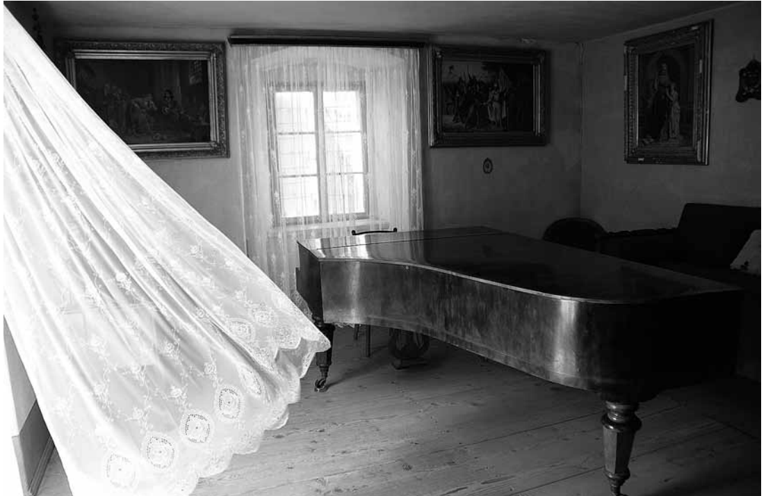
sl.7. Glazbena soba, Pustinja Blaca.