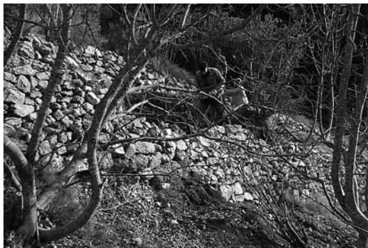
sl.14. Sanacija dijela oštećenog krovništva nakon odrona stijena u Pustinji Blaca