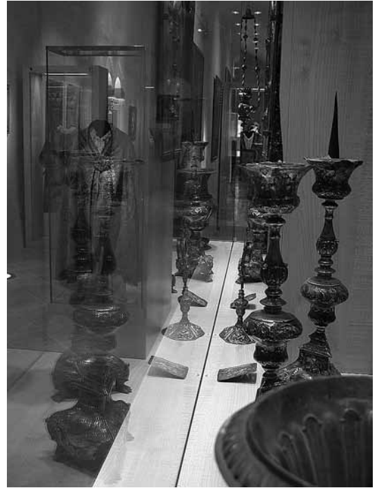
sl.13. Izložbeni prostor iznad desne lađe, inventar 18., 19. i 20.st.