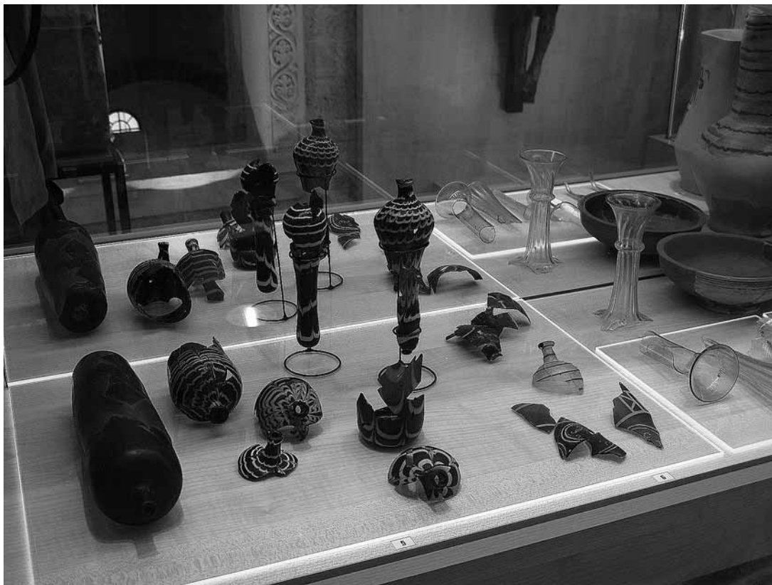
sl.6. Staklene boce i ulomci čaša, ukrašno festonima i pozlatom, 12. st.; staklena kandila, 13.-15. st.; staklene čaše, boce i svijećnjaci, 12.-14. st.; zdjela, keramika, 13. st.; vrc, majolika, 14. st.