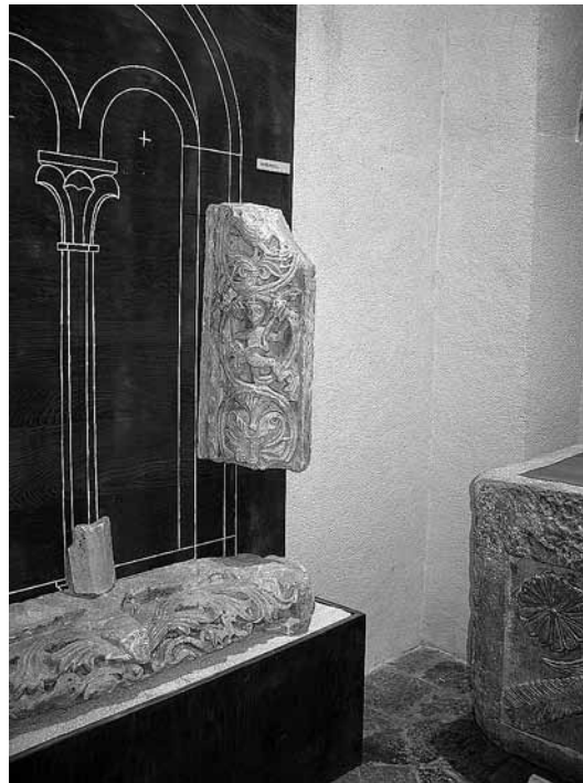
sl.1. Bifora sa pročelja katedrale (XII. stoljeće) i krstionica (početak IX. st.)

Zbog opisane nedostupnosti široj javnosti, izložbe kojima su u fokusu ti predmeti i eksponati sakralne baštine, a organiziraju ih specijalizirane ustanove (muzeji i galerije), izuzetno su važne. Teško dostupni predmeti, naime, prigodno se i povremeno, daju na uvid posjetiteljima i široj javnosti. Spomenuti izložbeni projekti imaju i dodatan učinak. Potiču stručno-znanstvena istraživanja, konkretno, temeljitu obradu predmeta, kao i njihovu zaštitu - restauraciju i konzervaciju. Javnim uvidom i znanstvenom interpretacijom produbljuje se i kulturno-povijesna slika te stječe predodžba o slojevitosti povijesti na našem prostoru.