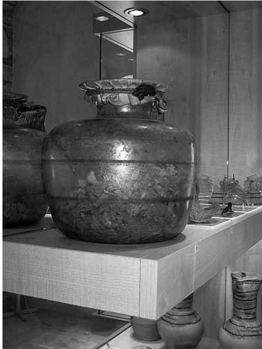
sl.5. Stakleno i keramičko posuđe, 12. do 14.st.