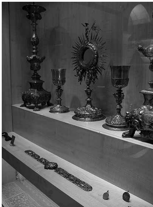
sl.10. Moćnik sv. Tome Apostola, srebro, 1687. god.

Kronološki vezano za prijelaz iz 15. u 16. st., u srednjem dijelu galerije izloženi su moćnici, dragocjeni dijelovi