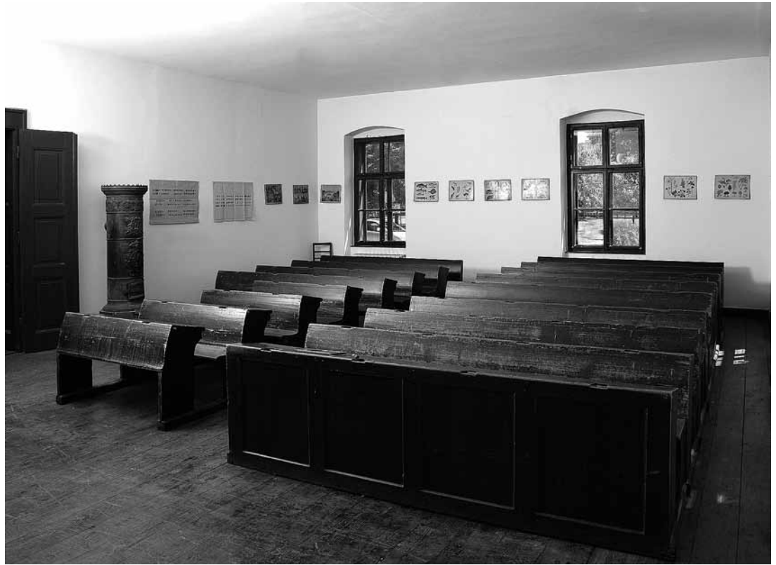
sl.1. Razred niže pučke škole u Kumrovcu: detalj stalnog postava Muzeja "Staro selo" Kumrovec Snimio: Srećko Budek, 2011.

Radni uvjeti u školi od samog su početka bili vrlo teški: učionica je bila premalena za toliki broj učenika, zima je nosila probleme nabave drva za ogrjev, plaća učitelja bila je vrlo malena, a zahtjevi su bili sve veći. Spomenuti problemi potaknuli su Kolomana pl. Barabaša na promjenu radnog mjesta - na vlastiti je zahtjev premješten je u Jalžabet, dok je Juraj Marković imenovan namjesnim učiteljem u Kumrovcu. Ubrzo je, zbog bolesti, učitelja Markovića, zamijenila Ljubica Hodalić. Nakon smrti J. Markovića (1904.) na njegovo je mjesto imenovan Stjepan Vimpošek. Vrijeme službovanja spomenutih učitelja obilježilo je školovanje i Josipa Broza (1900.-1905.), najpoznatijeg đaka kumrovečke niže pučke škole.