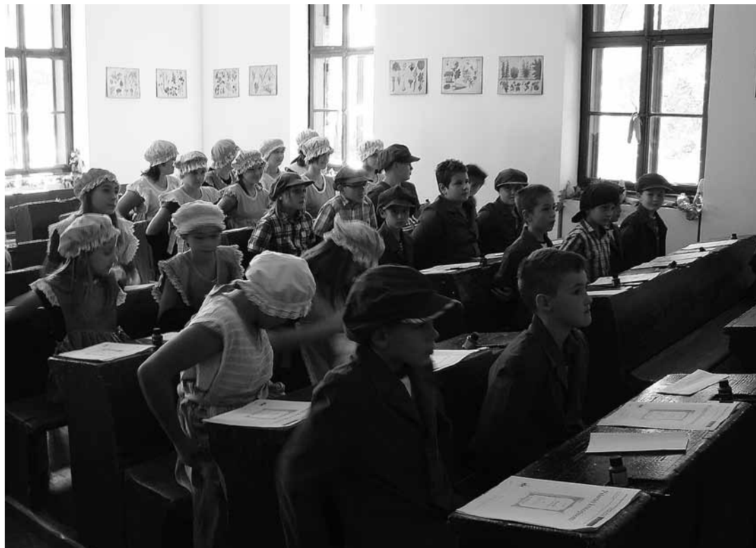
sl. 4. Gostujuća radionica Hrvatskoga školskog muzeja u Muzeju "Staro selo" Kumrovec: Pisanje krasopisa , održano 1. listopada 2011., uz otvorenje stalnog postava Razred kumrovečke niže pučke škole , pod stručnim vodstvom Branke Manin Snimila: Željka Šipek, 2011.

development of education in Kumrovec hamlet necessarily arises.