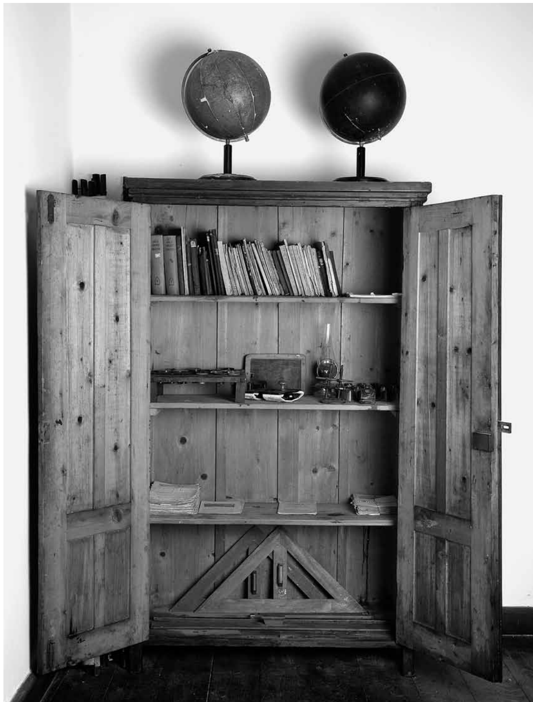
sl. 2. Školski ormar s nastavnim učilima; detalj stalnog postava Muzeja "Staro selo" Kumrovec Snimio: Srećko Budek, 2011.