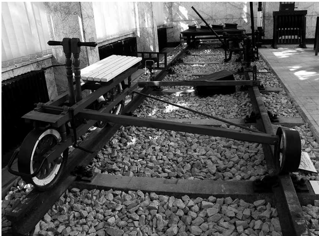
sl.5. Pružni tricikl na stalnoj izložbi

Autorica koncepcije izložbe i izložbenog postava je Tamara Štefanac, a autorica tekstova Helena Bunijevac. Tekstove je lektorirao Ivan Marković, a na engleski jezik preveli Elena Lalić i Bruna Šarić. Stručni suradnici bili su Pavo Božičević, Anto Zovkić, Miroslav Gagro, Emil Gubica, Milan Ivković, Željko Delač, Zdenko Fučkar, Milan Brkić, Vladimir Njegovan, Vesna Lipovac, Anton Pavić.