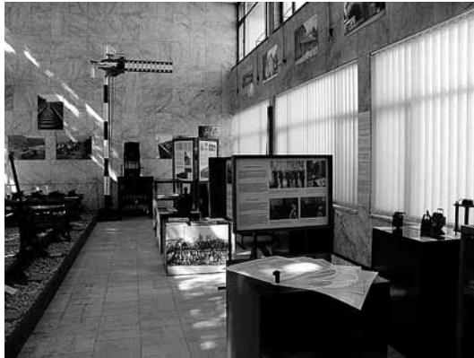
sl.7. Stalna izložba Životopis vinkovačkoga prometnog čvorišta na željezničkom kolodvoru Vinkovci

kolodvora zapravo su dnevni život na kolodvoru u kojima šefovi kolodvora imaju obvezu zapisati svaki važniji, a posebno neregularni događaj koji se zbija na kolodvorskom području.