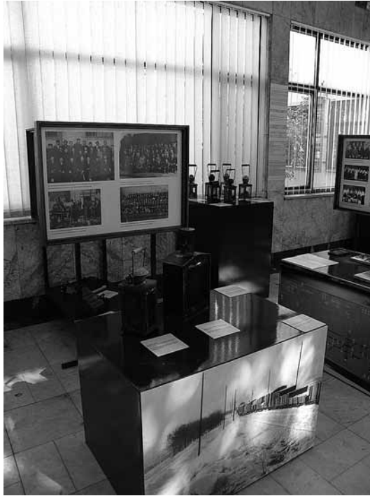
sl.6. Detalj postava izložbe