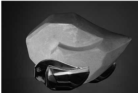
sl.6. Nojevi inv. br. G-MZP-3563 bronca: 9,5 x 3 x 15 cm