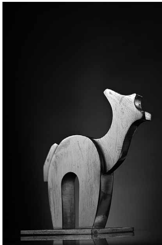
sl.1. Noj inv. br. G-MZP-3530 mramor: 32 x 8 x 24 cm bronca: 12 x 2,2 x 10 cm sl.2. Deva inv. br. G-MZP-3558 bronca: 9,6 x 1,5 x 10 cm

Akademski kipar Zlatko Zlatić jedan je od umjetnika koji je svome rodnom gradu darovao zbirku animalističkih figura, poklonivši mu na taj način ne samo plodove svog rada, nego i spomen na osobnu ljubav prema životinjama, koja se očituje u svakoj figurini koju je izradio. Zbog istih je razloga naklonjenosti i skrbi prema malim dragocjenostima želio osigurati najbolji smještaj za njih, pa je, predajući donaciju, postavio uvjet smještaja svojih skulptura - u zagrebački Zoološki vrt. Zaista, bolji dom figurine nisu mogle pronaći. Uz okruženje u kojemu se nalaze živi primjerci nekih od prikazanih životinja, zbirka je naišla na mnoštvo ljubitelja životinja koji posjećuju ZOO, a među njima su i oni najmlađi, koji pokazuju poseban senzibilitet prema živim bićima, kao i prema njihovim minijaturama. Spoj animalističkih figura i stanovnika ZOO-a sretno je rješenje za zbirku, kao i za ponudu Vrta koji je time dobio dodatnu estetsku, umjetničku i edukativnu vrijednost.