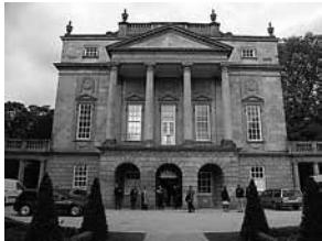
sl.1. Holburne muzej u Bathu, Velika Britanija