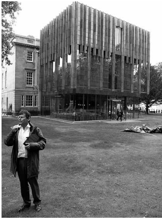
sl.3. Keramička i staklena oplata