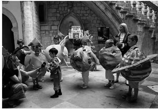
sl.8. Snimka sa zatvaranja izložbe.