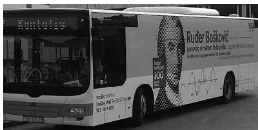
sl.9.-10. Autobusi javnoga gradskog prijevoza također su bili brendirani, kao i autobusne karte. Velika reklama za izložbu bila je postavljena i na terminalu za dolaske u dubrovačkoj zračnoj luci, kao i na autobusu za prijevoz putnika.

childhood, Bošković as writer and diplomat, as well as a top flight scientist in various scientific areas, including statics, physics, geodesy, hydraulic engineering, optics, meteorology, archaeology, astronomy and mathematics. This is a unique complete presentation of Bošković in the context of the celebration of the 3 rd centenary of his birth.