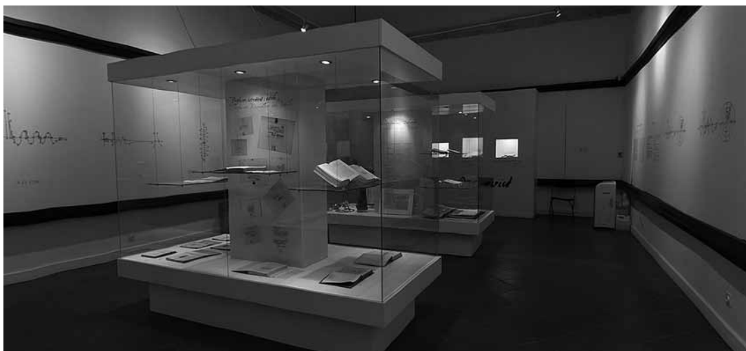
sl.4.-5. Izložba Ruđer Bošković ponovno u rodnom Dubrovniku - Hrvatska slavi svoga genija povodom 300. obljetnice rođenja, koja je tijekom pet mjeseci zabilježila više od 204 000 posjetitelja.

U Etnografskome muzeju, smještenome u žitnici Rupe , kustosica Branka Hajdić osmislila je radionicu mjerenja zapremine 15 suhih bunara u kojima se od 1590. g. skladištilo žito. Svoje su izračune mladi fizičari i matematičari prezentirali neposredno prije otvorenja izložbe, i to Ruđeru Boškoviću osobno, kojega je utjelovio nagradivani dubrovački turistički vodič Marojica Bijelić. On je u liku Ruđera obavio i stručno vodstvo kroz Dubrovnik Boškovićeve doba, kao i još nekoliko kostimiranih stručnih vodstava kroz izložbu, uključujući i vodstvo na zatvaranju izložbe, kojemu je prisustvovalo nekoliko stotina Dubrovčana.