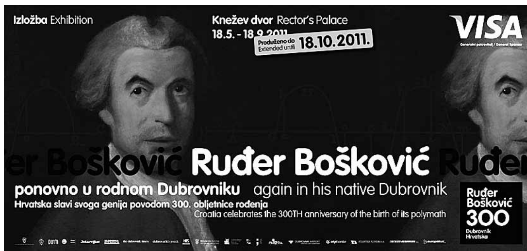
sl.1. Dubrovački muzeji osmislili su i realizirali seriju projekata u sklopu obilježavanja 300. obljetnice rođenja Ruđera Josipa Boškovića (Dubrovnik, 18. svibnja 1711. - Milano, 13. veljače 1787.)

JULIJANA ANTIĆ BRAUTOVIĆ, IVONA MICHL, PAVICA VILAČ □ Dubrovački muzeji, Dubrovnik