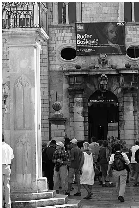
sl.2.-3. U povijesnoj je jezgri postavljeno pet velikih bannera s vizualom projekta. Dva su bila postavljena na Kneževu dvoru, a po jedan na istočnome i zapadnom ulazu u Grad te na zgradi Luže na dnu Straduna.

Zanimljiv dio izložbe svakako je bio i dio Boškovićeve prepiske s obitelji, prijateljima, vlastodržcima i znamenitim znanstvenicima svoga vremena, koja je širokoj javnosti prvi put prezentirana na ovoj, dubrovačkoj izložbi. Riječ je o mikrofilmiranim dokumentima otkupljenima od Bancroft Library Sveučilišta Berkeley u Kaliforniji, gdje se čuva vrlo opsežna i vrijedna građa u kolekciji pod nazivom Ruggero Giuseppe Boscovich papers .