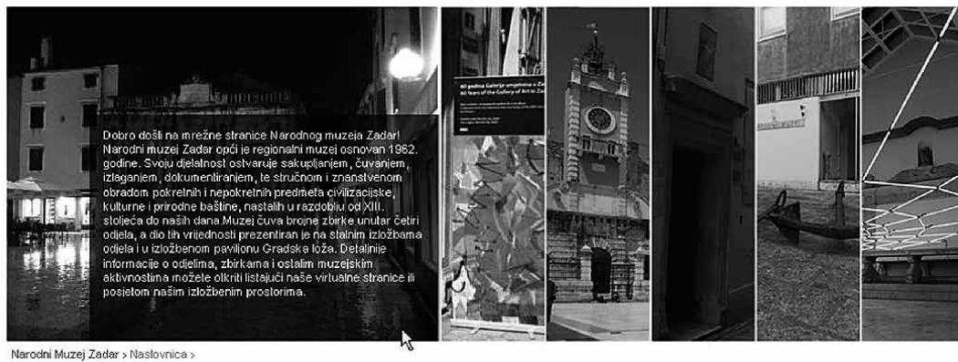
sl.1. Izgled glavnog izbornika i animiranog zaglavlja

Sadržaj na stranicama uglavnom je podijeljen na dva stupca. Lijevi služi za glavni sadržaj neke stranice, a desni za pomoćni sadržaj (aktualne izložbe i događanja, adrese, kontakti, kustosi, zbirke, arhive izložbi i izdanja), tj. za poveznice sa sadržajem u lijevom stupcu.