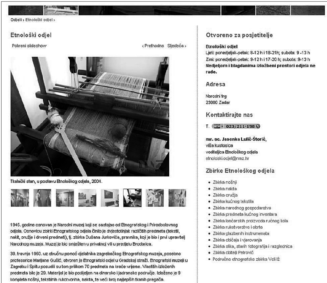
sl.2. Prikaz stranice Etnološkog odjela

Stranica s aktualnim izložbama u lijevom stupcu donosi popis aktualnih izložbi sa sažecima, a one su povezane s detaljnim opisom izložbe koju prati galerija odabranih slika s izložbe. Desni stupac tih stranica sadržava poveznicu na arhivu izložbi i kontaktne formulare. Stranica s arhivom izložbi na lijevoj strani nudi mogućnost izbora i pregleda izložbi prema godinama u PDF formatu, a od 2009., kada su stranice postavljene, pregled izložbi je u digitalnoj arhivi. Desni stupac te stranice sadržava vezani popis trenutnih događanja u Muzeju te vezu na aktualne izložbe i kontaktne formulare.