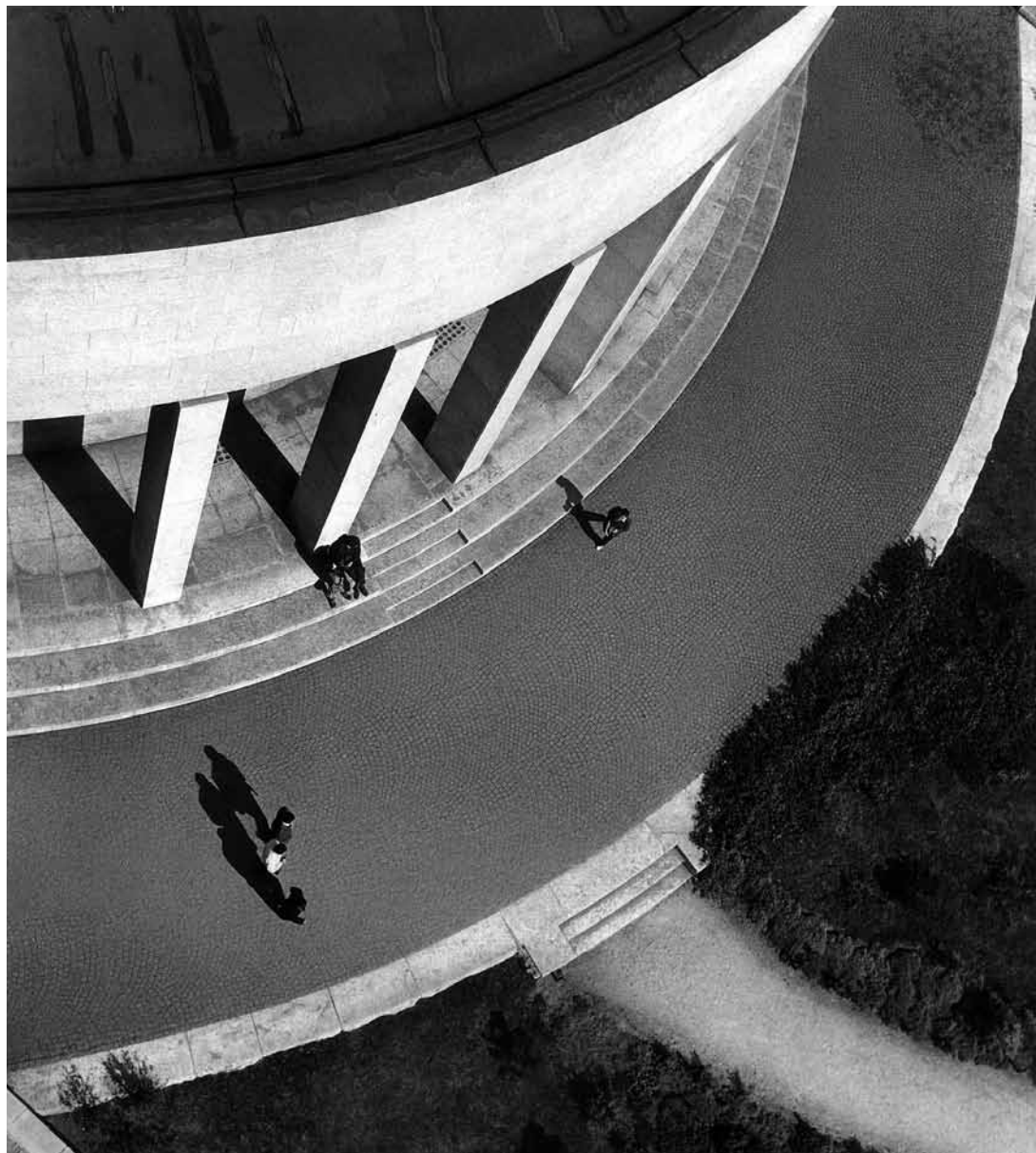
sl.9. Mladen Grčević - Iz ptičje perspektive