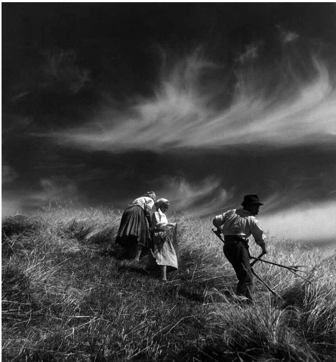
sl.1. August Frajtič - Kruh naš svagdanji

Da bismo danas u cijelosti mogli sagledati veličinu i značenje fenomena tzv. zagrebačke škole fotografije, iz 1930-ih godina, moramo se vratiti malo u prošlost, u drugu polovicu 19. st.