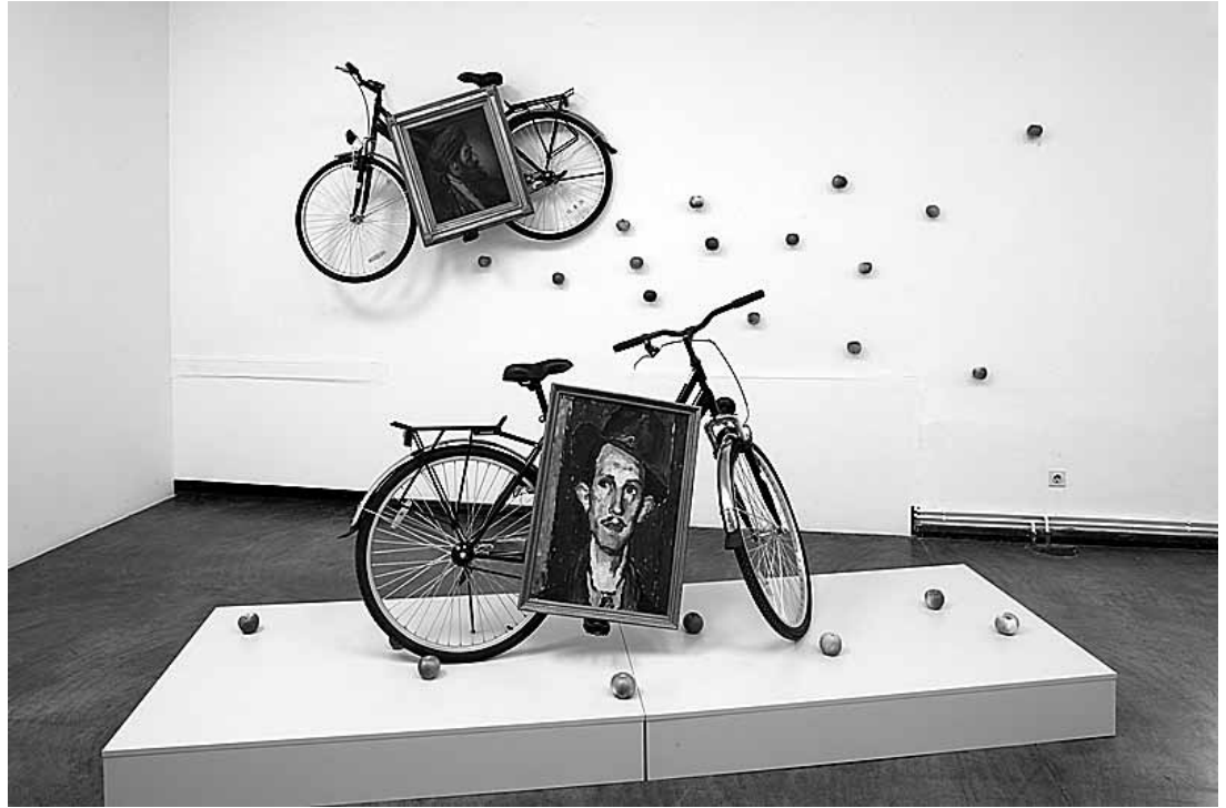
sl.3. Braco Dimitrijević: Tryptichos Post Historicus , 2005. instalacija (2 bicikle, jabuke, postamenti, slike iz zbirke MMSU: MMSU-66, MMSU-1597) varijabilne dimenzije MMSU-2772

prenosi krhko uređen svijet na istančanim frekvencijama između prisutnosti i odsutnosti, zbilje i iluzije, prošloga i sadašnjega, s otvorenim smislom.