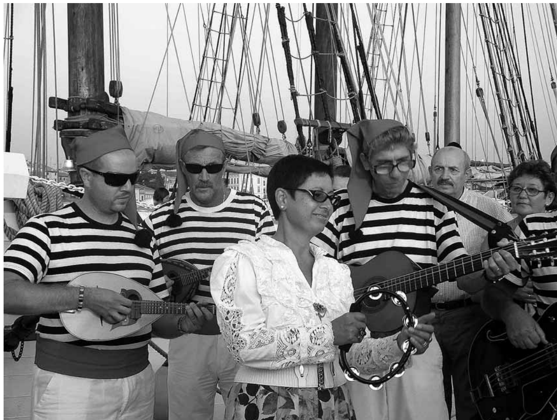
sl.9. Dolazak predstavnika Pomorskog muzeja Barcelone na XVI. forum pomorske baštine Mediterana. Organizator foruma je rovinjski Ekomuzej Kuća o batani.