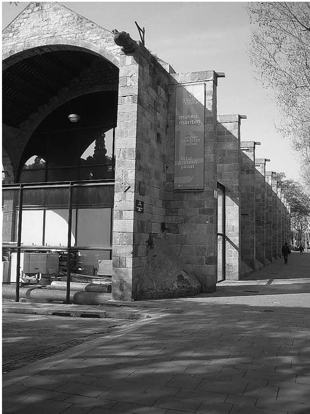
sl.5. Pogled na zgradu Pomorskog muzeja Barcelona, 2008.

Novo doba donijelo je radikalne promjene u korištenju tih brodogradilišta. Čini se da su ona do 17. stoljeća služila isključivo za gradnju brodova, a zatim su prešla pod upravu vojske i od tada su se koristila isključivo u vojne svrhe te su postala spremište oružja.