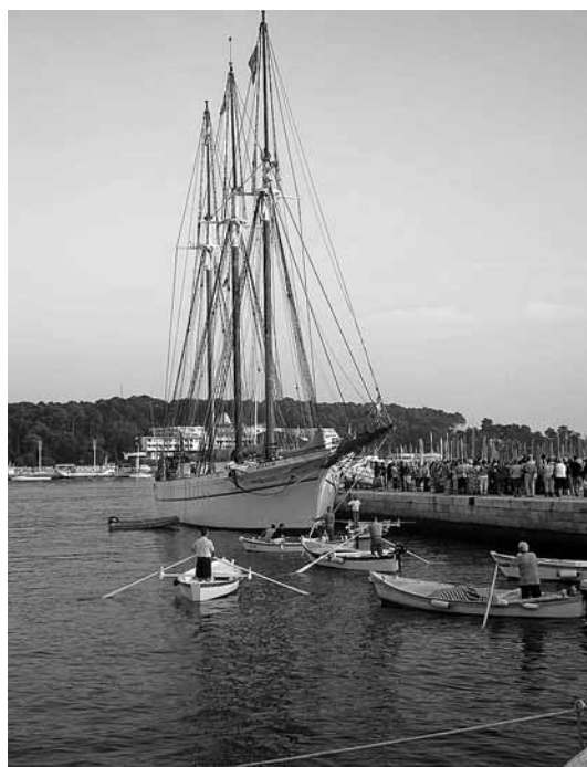
sl.10. El Pailebot Santa Eulàlia (jedrenjak u posjedu Povijesnog muzeja Barcelone) na gostovanju u rovinjskoj luci u vrijeme održavanja XVI. foruma pomorske baštine Mediterana.

Osnivanje mreža jedna je od najučinkovitijih strategija za odgovorno i ozbiljno teritorijalno upravljanje, za poboljšanje učinkovitosti ulaganja, razmjene iskustava i znanja među institucijama i stručnjacima, te za planiranje koje će osigurati budućnost ovih kulturnih institucija.