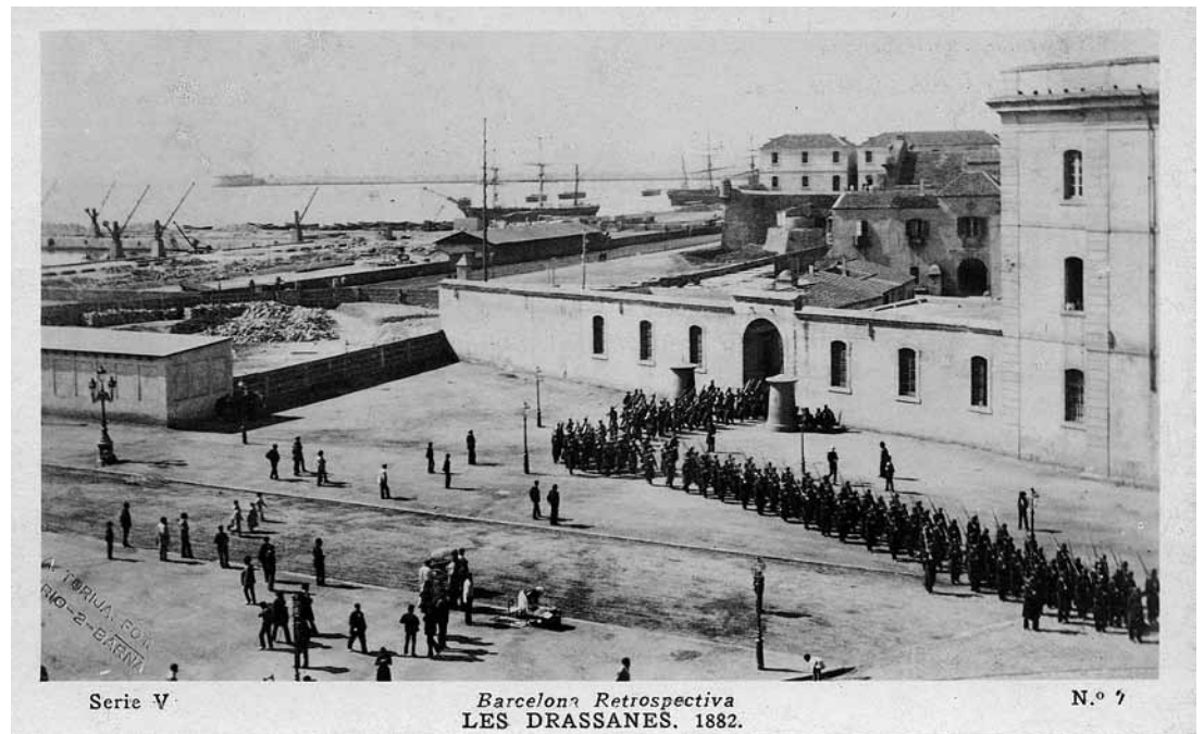
sl.1. Panoramska snimka Les Drassanes Reials de Barcelona, 1882.