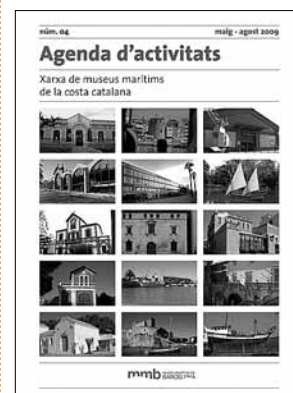
sl.11. Promotivni materijal Mreže pomorskih muzeja na katalonskoj obali.

Osnivanje Mreže pomorskih muzeja katalonske obale odobrilo je Opće Vijeće konzorcija Les Drassanes Reials Brodogradilišta i Pomorskog muzeja Barcelone na sjednici održanoj 5. srpnja 2006. godine. U sporazumu