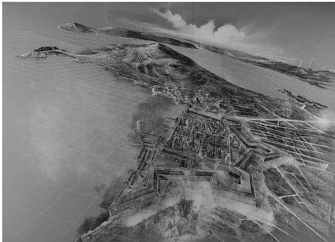
sl.5. Rekonstrukcija izgleda Splita oko 1700.

oko nekadašnjih zidina konačni oblik dobiva za vrijeme Kandlijskog rata (1645. - 1669.). U zvijezdi vaubanovskog sustava bastiona ispunjenih zemljom izgrađena su dva polubastiona na istočnome i zapadnom dijelu prema moru te tri bastiona prema kopnu. U isto se vrijeme istočno od grada podiže tvrđava Gripe. Bastion Cornaro dovršen je 1664. g.