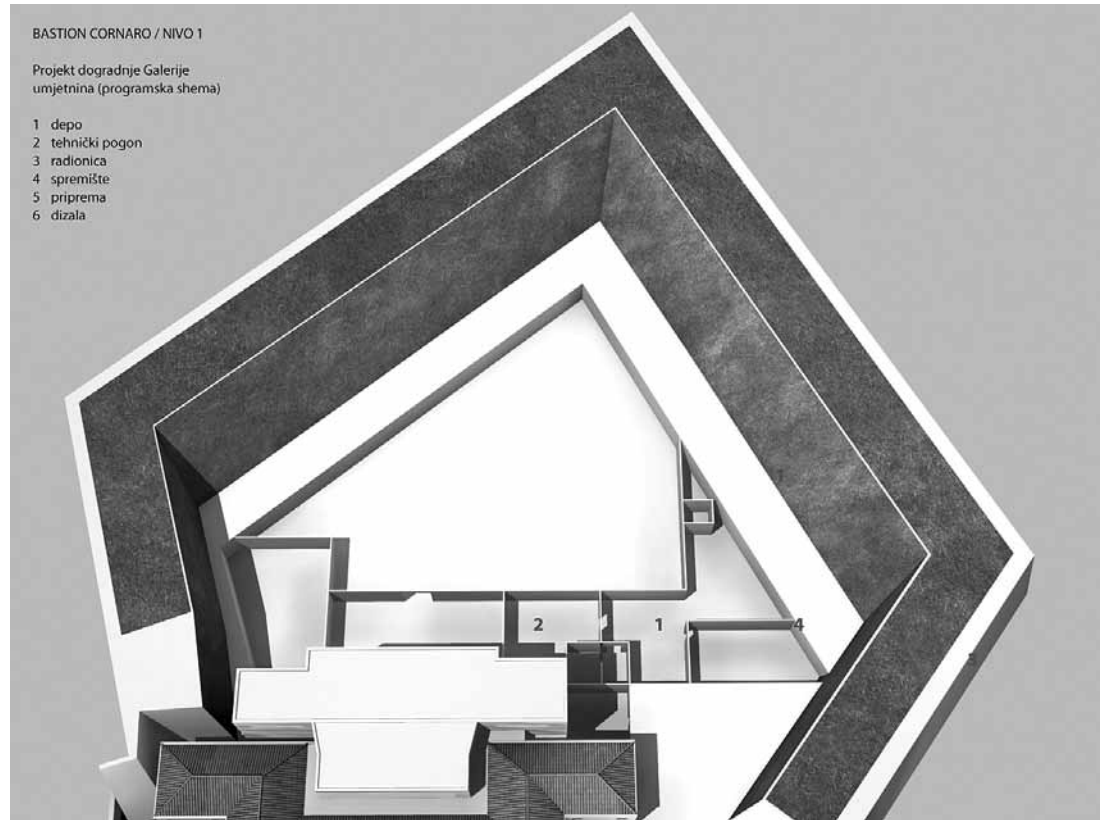
sl.7. Bastion Cornaro, Nivo 1, Projekt dogradnje Galerije umjetnina (programska shema)

u Hrvatskoj. Površina Muzeja suvremene umjetnosti u Zagrebu jest 14500 m 2 , dok je planirana kvadratura Muzeja moderne i suvremene umjetnosti u Rijeci 9000 m 2 . Iz navedenoga je razvidno da će se tek dogradnjom unutar bedema dosegnuti muzejski standardi.