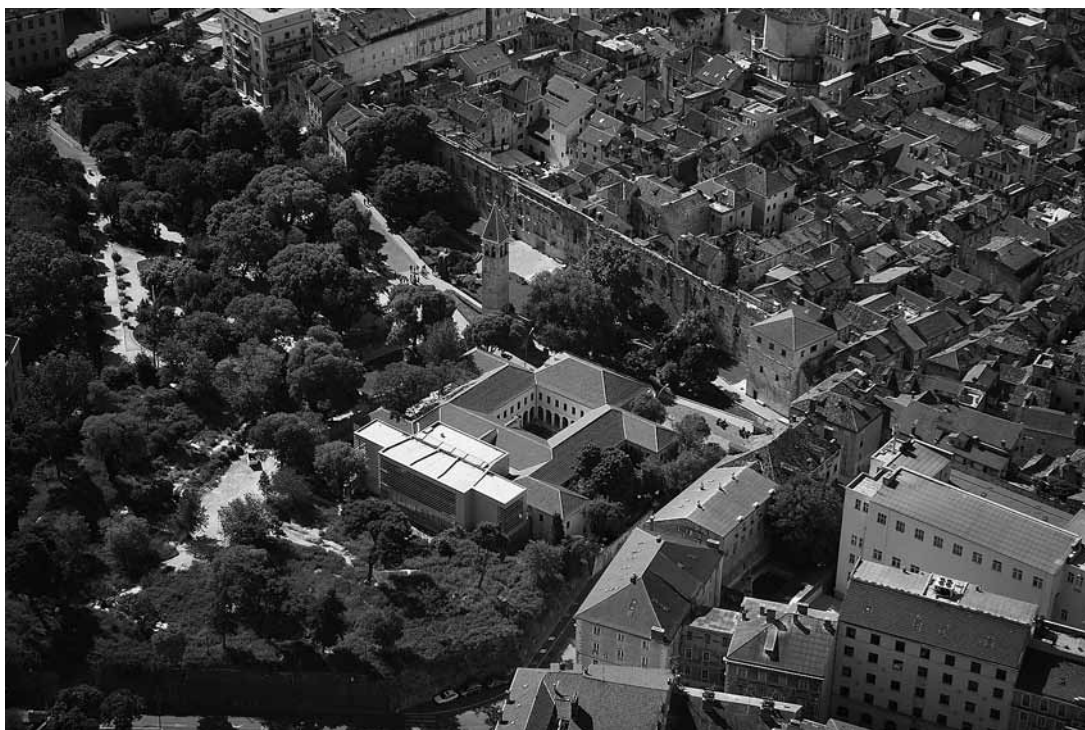
sl.1. Galerija umjetnina i bastion Cornaro

BOŽO MAJSTOROVIĆ □ Galerija umjetnina, Split