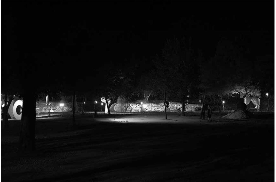
sl.2. Izložba Artikulacija prostora - Radovi u tijeku , bastion Cornaro, 2008.