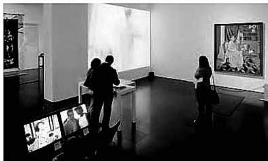
sl.8.-11. Snimke s izložbe Desacuerdos iz 2005.