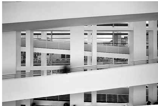
sl.6.-7. Atrij s rampama za vertikalnu komunikaciju MACBA © Rafael Vargas, 2008.

S legalnog stajališta, MACBA je prilično rijedak primjer sinergije javnoga i privatnog sektora: 1987. grupa katalonskih poduzetnika i tvrtki osnovali su Fundaciju MACBA, a sljedeće je godine utemeljen konzorcij koji osim Fundacije obuhvaća i Gradsko vijeće Barcelone i Vladu Katalonije. Javne su institucije pritom zadužene za osiguravanje godišnjih tekućih troškova rada Muzeja, a Fundacija je odgovorna za njegov menadžment i prikupljanje sredstava za proširenje muzejske zbirke. U Fundaciji je danas aktivno 38 članova Patronata i 33 osnivačke tvrtke, koji osim davanja financijske potpore iz vlastitih izvora rade na privlačenju novih privatnih i korporativnih suradnika.