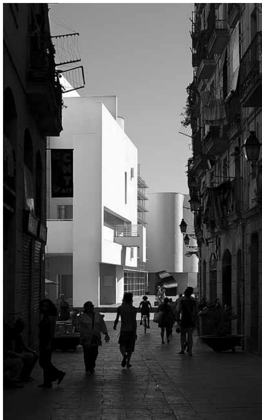
sl.4.-5. Pogled na pročelje muzeja iz jedne od bočnih ulica MACBA

Inspirirana Le Corbusierom te volumenom i formom u snažnom kontrastu s okruženjem, građevina je postavljena transversalno na Casa de la Caritat s CCCB-om, oblikujući tako dva trga. Prvi, Plaça dels Angels, ispred glavnog pročelja, danas je omiljeno okupljalište skatera , a s unutarnjim dvorištem na začelju Muzeja povezan je lagano zakrivljenim pješačkim prolazom uz ulazni atrij. Iako na prvi pogled djeluje kao strano tijelo u okolnome urbanom tkivu, ponajprije zbog sjajno bijelih i ostakljenih ploha pročelja, kombinacijom geometrijskih linija glavnog bloka i zaobljenih elemenata na oba kraja ostvaruje se interakcija unutarnjih i vanjskih prostora. Oba cilindrična volumena protežu se kroz sve četiri etaže (od kojih je jedna podzemna te, uz iznimku auditorija, zatvorena za javnost) i u njima se, jednako kao i u središnjem bloku, nalaze izložbeni prostori. Sedam etaža manjeg bloka, odijeljenoga pješačkim prolazom, namijenjeno je uredi-