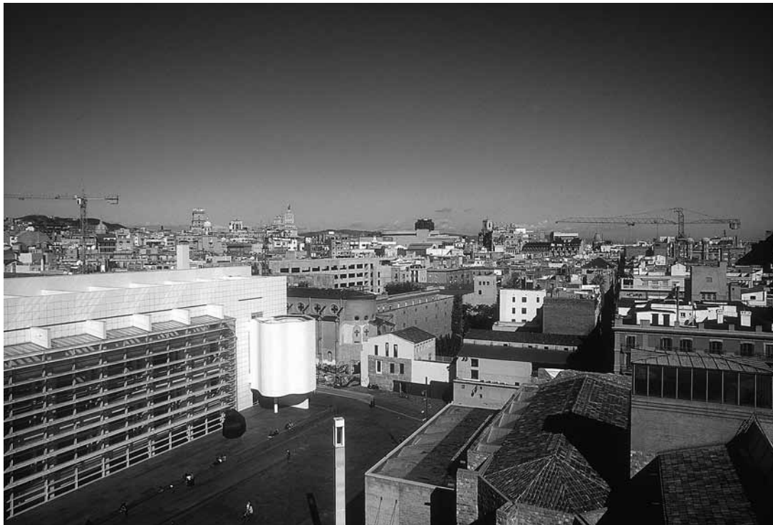
sl.1. Allen unutar srednjovjekovne četvrti Raval MACBA © Javier Tles, 2004.

IM 41 (1-4) 2010. IZ MUZEJSKE TEORIJE I PRAKSE MUSEUM THEORY AND PRACTICE