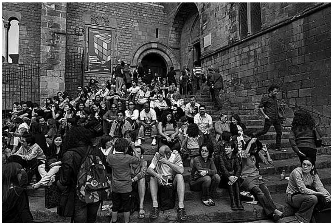
sl.1.-4. Izložba Barcelona - Madrid , 40 godina djelovanja lokalnih zajednica

CARMEN GARCIA SOLER □ Povijesni muzej Barcelone (El Museu d'Història de Barcelona), Barcelona