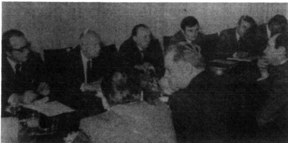
Razgovor u Gradskoj vijećnici o programu razvoja kulture i zaštiti spomeničke baštine, 1. II 1979.