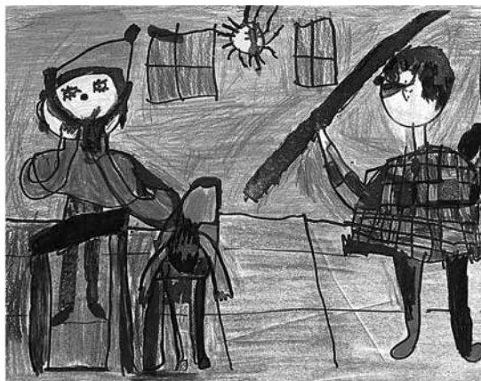
sl.1.-2. Slikovnica za djecu Bakina bilježnica / I quaderni della nonna , 2010. Izdanje: Muzej - Museo Lapidarium, Novigrad - Cittanova