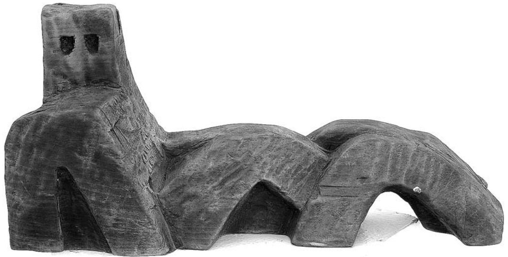
sl.3. Henry Moore bronca, v=12 cm