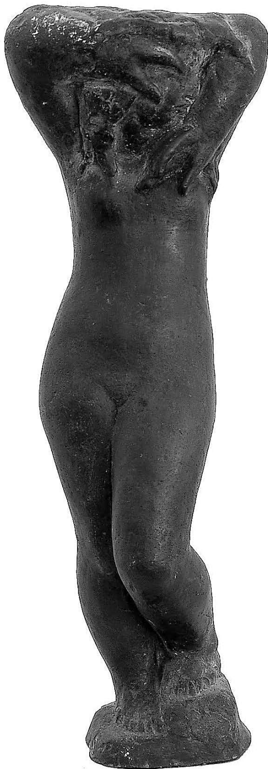
sl.1. Frano Kršinić, Buđenje , 1955. bronce, v=44 cm

suvremenih kulturnih programa u Veloj Luci, Galerija je bila i mjesto promocije brojnih publikacija, mjesto održavanja koncerata, filmskih projekcija, večeri poezije i različitih predavanja.