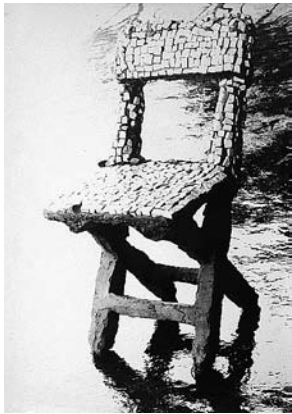
sl.7. Ivan Kožarić Svjetlo i sjena , 1975. v=23 cm