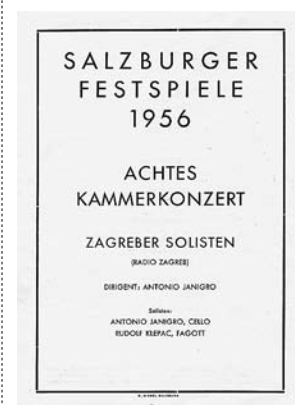
sl.7. Program koncerta sa Zagrebačkim solistima na Salzburškim svečanim igrama 1956.

pokal vlade pokrajine Salzburger Land. 19 Srebrna Mozartova medalja Međunarodne zaklade Mozarteum (Internationale Stiftung Mozarteum) dodijeljena mu je 5. prosinca 1975. za izvrsnu interpretaciju Mozartove glazbe za fagot. 20 Nakon umirovljenja 1978. pa sve do 1992. g. redovito se vraćao u Salzburg kao koncertni umjetnik, dirigent i pedagog