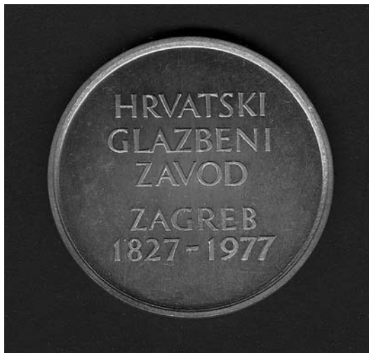
sl.10. Medalja Hrvatskoga glazbenog zavoda 1977.