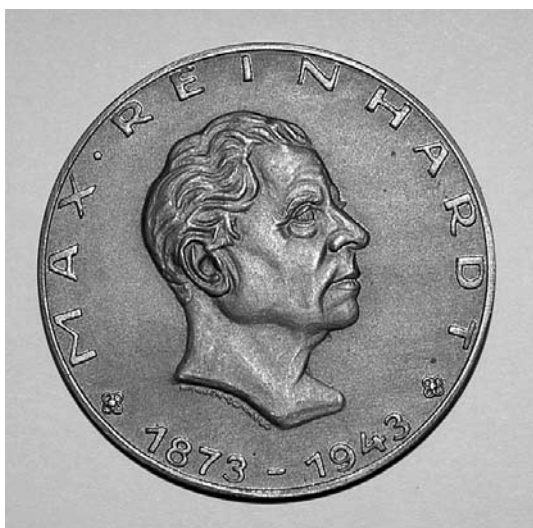
sl.11. Medalja Maxa Reinhardta dodijeljena 1962.