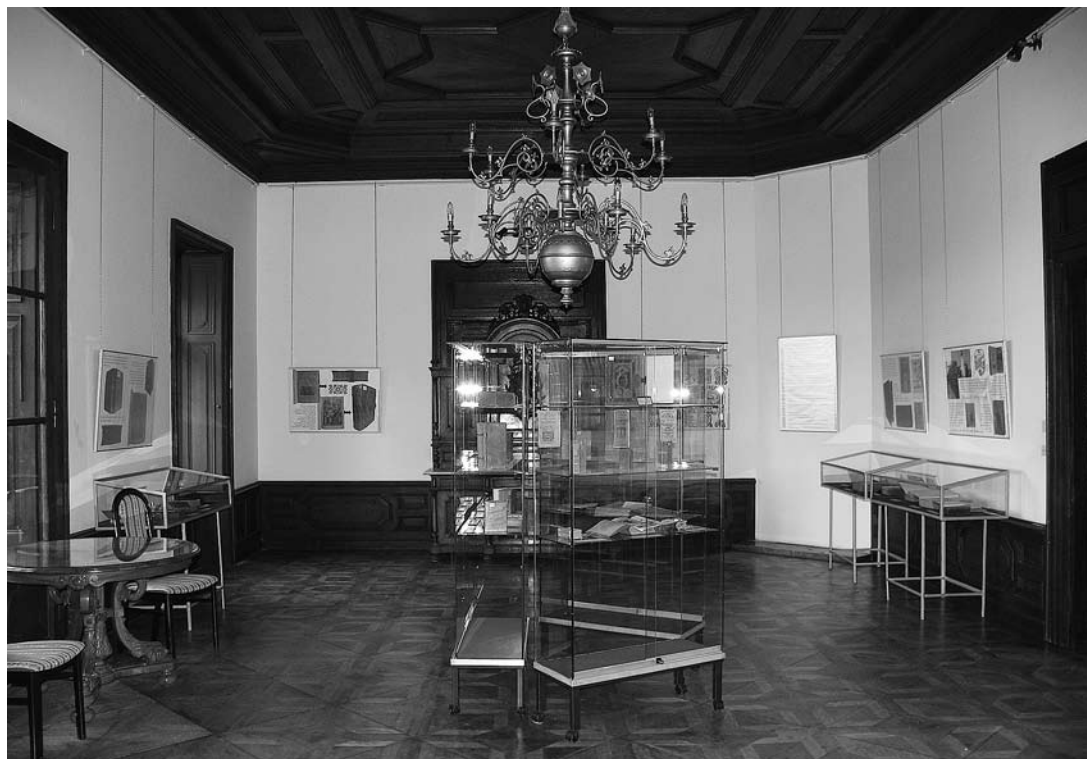
sl.1-3. Izložba Knjige 16. i 17. st. iz knjižnice Franjevačkog samostana Našice , Zavičajni muzej Našice, 2008.

RENATA BOŠNJAKOVIĆ □ Zavičajni muzej Našice, Našice