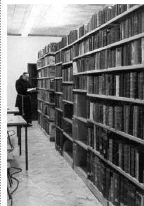
sl.6. Knjižnica Franjevačkog samostana Našice

Franjevac Ivan Ančić (poč. 17. st. - 1685.) napisao je Thesaurus perpetuus , zbirku oprosta i povlastica. U Knjižnici se čuvaju dva djela hrvatskog autora Mije Radnića (1636.-1707.). I prvo – Pogargegne izpraznosti od svijetai i drugo – Razmiscglagna pribogomiona od gliubavi Boxye napisano je hrvatskim jezikom, mješavinom ikavice i ijekavice.