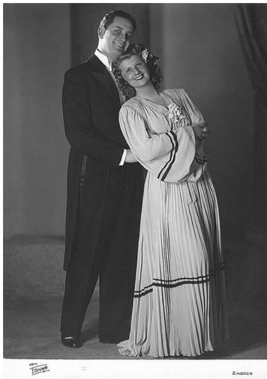
sl.6. Autogram-karta iz ateliera Tonka