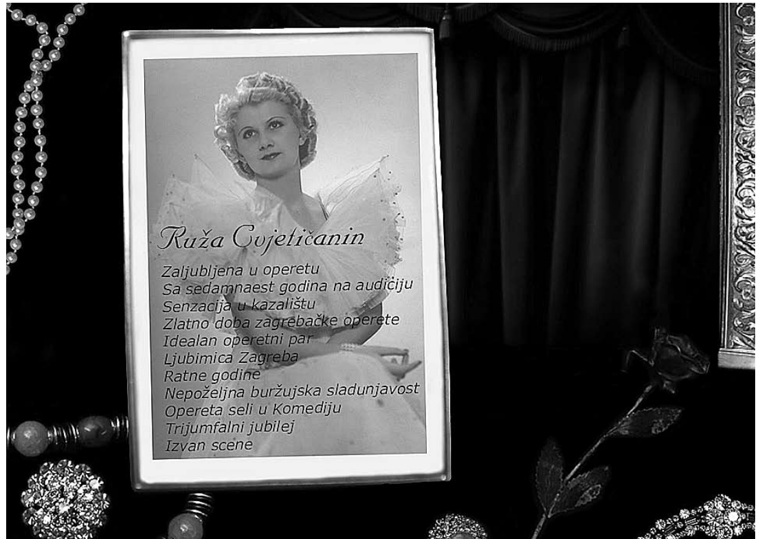
sl.8. Elementi multimedijske priče