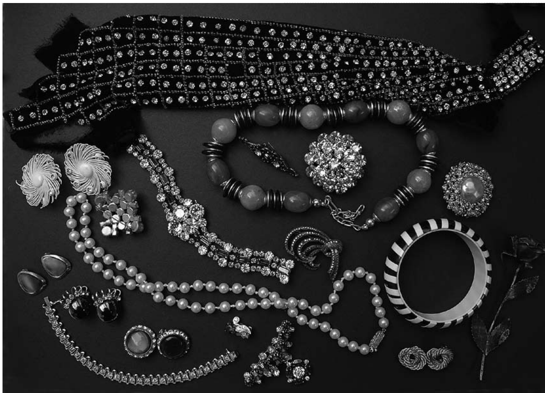
sl.9. Scenski nakit

(21. prosinca 1941.), Moja sestra i ja Ralpa Benatzkog (23. travnja 1942.), Ples u operi Richarda Heubergera (1943.), Ševa Franza Lehára (10. ožujka 1944.), Šišmiš Johanna Straussa, ml. (8. prosinca 1944.) i Zemlja smiješka Franza Lehára (21. prosinca 1944.).