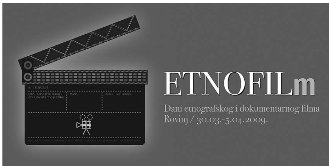
sl. 1. Plakat ETNOFILma