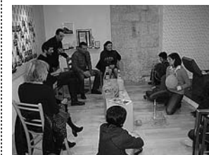
sl. 6. Radionica pletenja domižana

Za vizualni identitet festivala bio je odgovoran rovinjski dizajner Agron Lešdedaj.