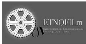
sl. 7. Vizualni identitet ETNOFILMA 2