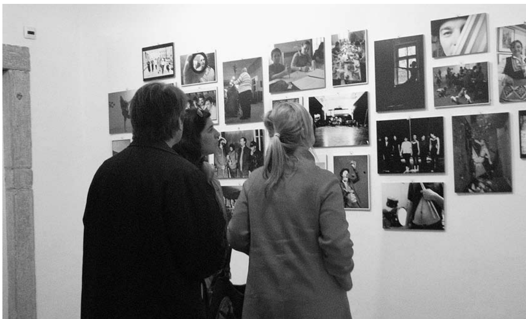
sl. 3. Otvoreње festivala ETNOFILM