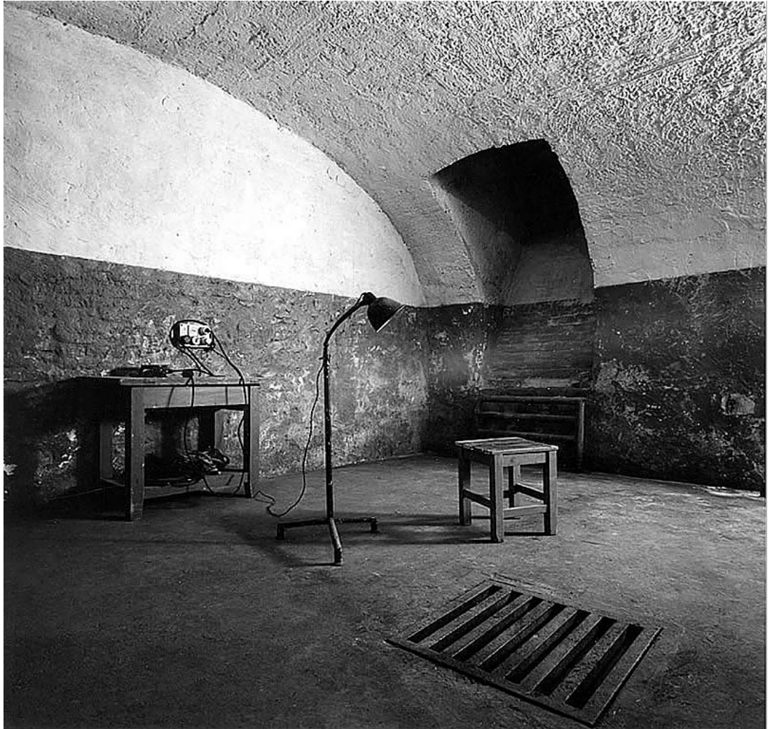
sl.3. Tamnice se prostiru na dvije razine ispod pločnika, a prikazani su svi tipovi ćelija i metode mučenja.

zidovi niz sablasnih arhivističkih registratora pojedinih slučajeva, a na velikom se monitoru prikazuje propagandni film o suđenju Imri Nagyju. Druga tema obrađuje odnos prema vjeri i crkvi – žestokim neprijateljima nacizma i komunizma. Cijelom dužinom dvorane u pod je ukopan križ, kao da je sakriven u zemlju; u dnu dvorane veliki zvučnici okružuju crkveno ruho, evocirajući tako agresivnu antireligijsku propagandu kojom su bili izvrgnuti ljudi u doba komunizma. Susjedna soba memorijal je posvećen kardinalu Mindszentyju, ključnoj osobi otpora i stradanja zbog zagovaranja prava na ispovijedanja vjere.