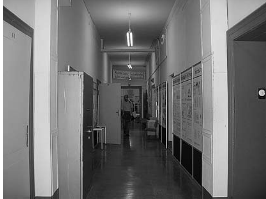
sl.2.-3. Stalna izložba u Kući na kružnom uglu Stasi - moć i banalnost : Panoi u hodniku muzeja i jedna od izložbenih soba

U muzeju se organiziraju i diskusije, filmske projekcije, čitanja i druga događanja.