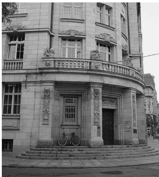
sl.1. Kuća na kružnom uglu, Leipzig

U Leipzigu, jednome od najvećih gradova DDR-a, u jesen 1989. g. započela je pobuna protiv autoritarnog režima, koja se proširila na cijelu Istočnu Njemačku. Tijekom te tzv. Mirne revolucije građani su 4. prosinca 1989. okupirali zgradu Runde Ecke. Iste je noći utemeljen Građanski odbor Leipziga, koji od tada upravlja muzejom – memorijalnim centrom, a njegov rad financiraju Federalna uprava za kulturu i medije, Saska fundacija za memorijalna mjesta, grad Leipzig i Gradski ured za kulturu. Odbor pokreće i vodi političke