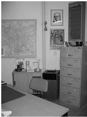
sl.5. Stalna izložba u Kući na kružnom uglu Stasi - moć i banalnost: Ured službenika Stasija u Kući na kružnom uglu