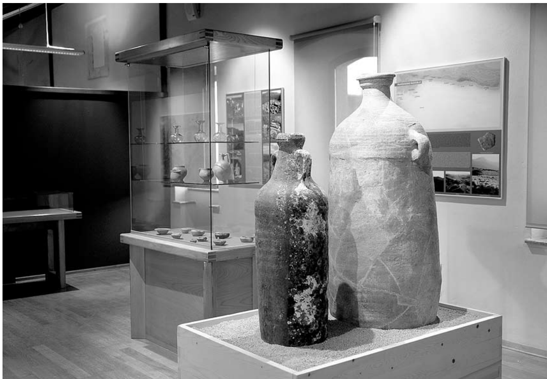
sl. 15.-16. Postav arheologije, sjeveroistočno krilo drugog kata kaštela.