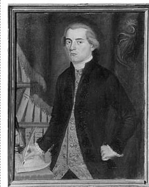
sl.11. Radoš Ante Michieli-Vitturi (utemeljitelj znanstvenog poljodjelstva u Dalmaciji, predsjednik splitske Agrarne akademije sa sjedištem u kaštelu Vitturi). ulje na platnu, oko 1790., vlasništvo Muzeja grada Splita

turske opasnosti 1648. godine, kad Klis ponovno dolazi pod vlast Venecije. Tada se pred utvrdom ili utvrđenim naseljem nasipa prostor na kojemu je bio most i tako nastaje seoski trg. Naziv dobiva po brvnu ili brvcu – drvenome mostu. Trg tako postaje stjecištem trgovačkoga, kulturnoga i političkog života mjesta. U južnom dijelu prostorije istaknuli smo važnost organizacije obrane od Turaka, koji se nakon zauzimanja Bosne 1463. godine zaljeću na splitski i trogirski teritorij pod vlašću Venecije. Istaknuli smo niz ratova između Venecije i Turske (1499. – 1502., 1537. – 1540.; Ciparski rat 1570. – 1573.; Kandijski rat 1645. – 1669.; Morejski rat 1684. – 1699.). U vitrini u zidnoj pregradi izloženi su originalni primjerci oružja koje se tada koristilo, a opisano je u različitim dokumentima. Aplicirana i uvećana mapa opsade Klisa podloga je za oružje.