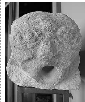
sl.19. Garguj, romanika, Stomorija, Kaštel Novi (u lapidariju).