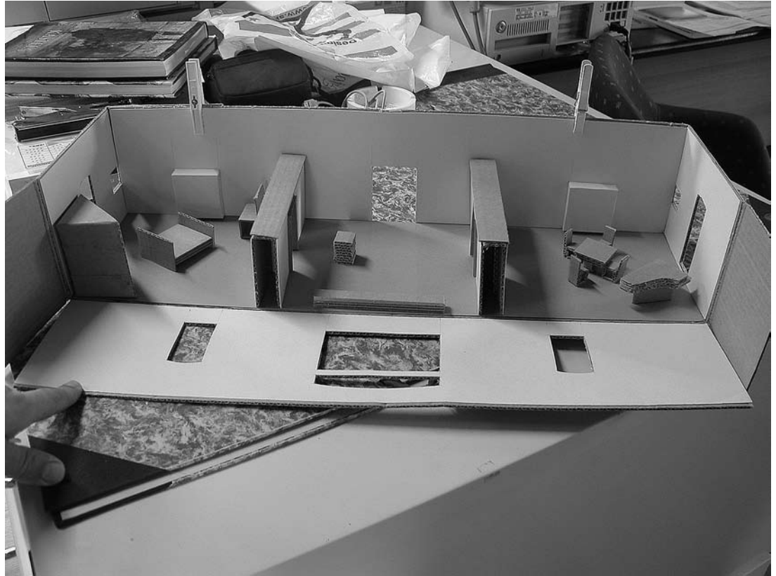
sl.3. Maketa južne dvorane drugog kata kaštela.