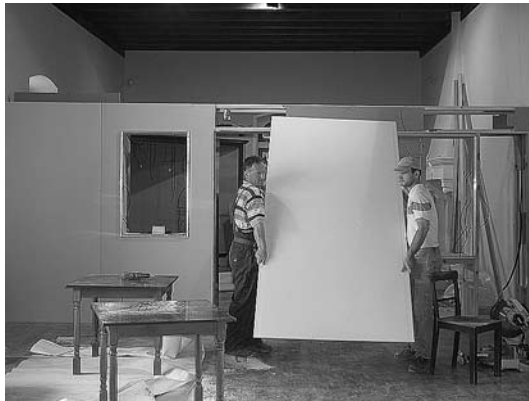
sl.4. Izgradnja pregradnih zidova u južnoj.

kustosima, zasad je omogućena samo realizacija prve faze postava, ona najnužnija. Trenutačno ne postoji mogućnost kružnoga obilaska stalne izložbe niti logičnog kretanja korisnika. Ta će komponenta biti zadovoljena u drugoj fazi, nakon premještanja uredskih prostorija. Muzeološka koncepcija izrađena je s ciljem interpretiranja i prezentacije života na tom prostoru od prapovijesti do 20. stoljeća, tj. ocrta nastanak današnjega grada u povijesnome, arhitektonsko-urbani-stičkome, crkvenome i kulturno-povijesnom smislu.