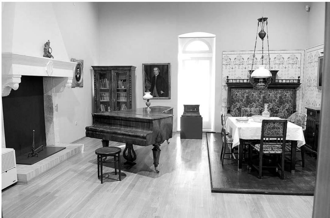
sl.10. Kaštelanski tinela , istočna prostorija južne dvorane na drugom katu.