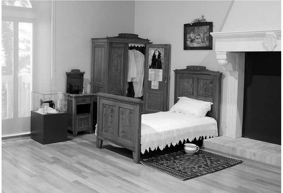
sl. 12. - 14. Spavaća soba u zapadnoj prostoriji južne dvorane drugog kata.