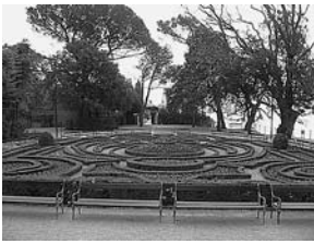
sl.1. i 2. Zgrada i park Hrvatskog muzeja turizma (Villa Angiolina), Opatija

MIRJANA KOS NALIS □ Hrvatski muzej turizma, Opatija