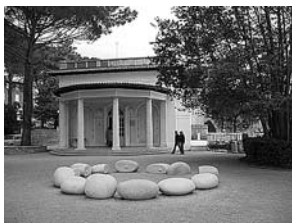
sl.7. Umjetnički paviljonu "Juraj Šporer", Opatija