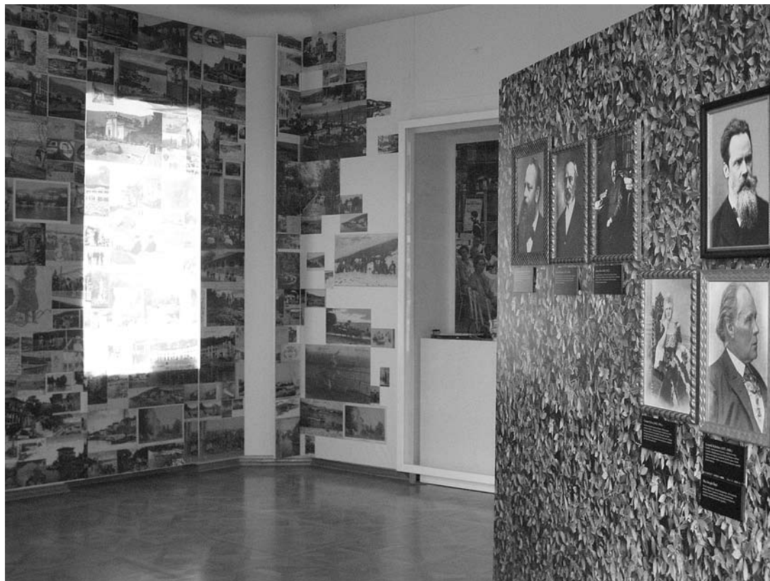
sl.3. - 6. Stalni postav Hrvatski muzej turizma