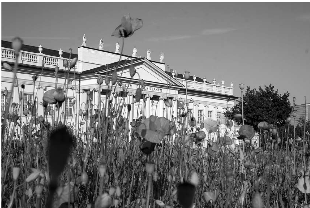
sl.9. Sanja Iveković, Polje makova / Poppy Field , 2007.