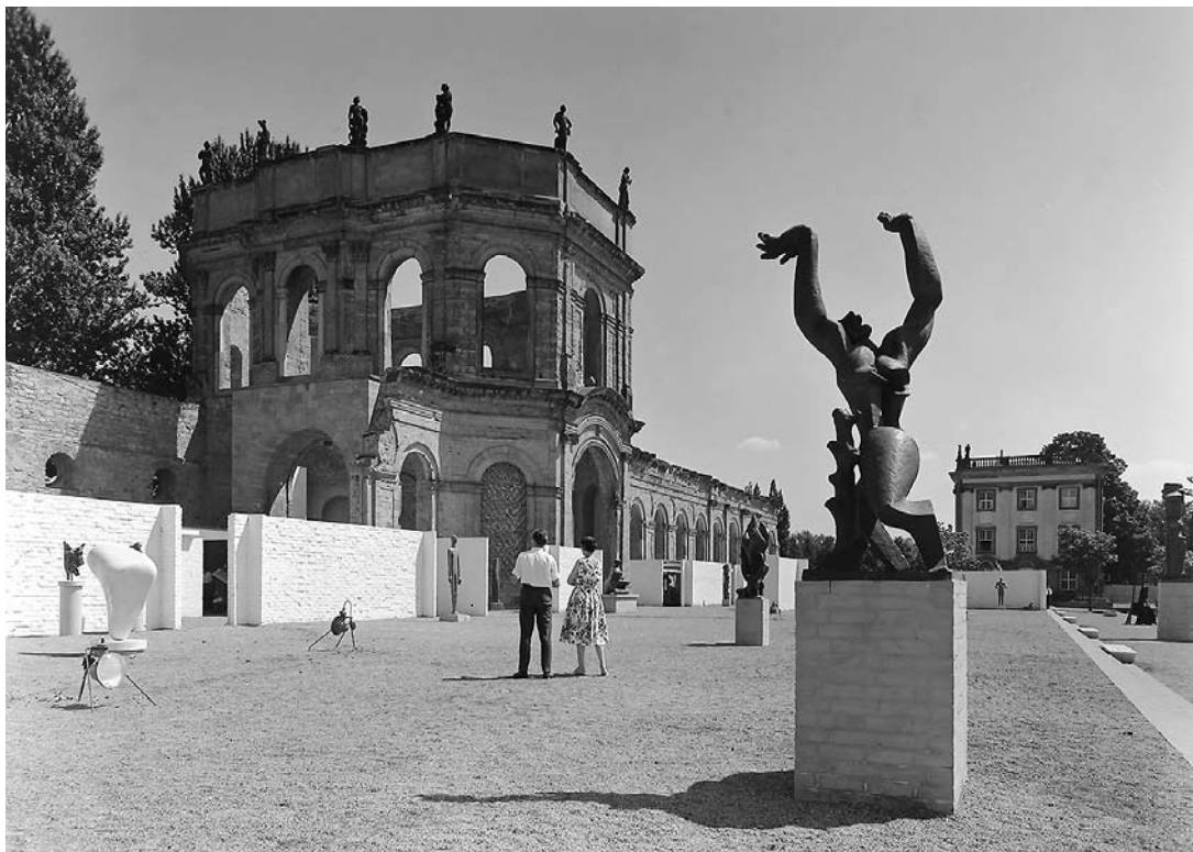
sl.2. Orangerie u Karlsaue, Kassel

stilskih kategorija i činila poligon za postavljanje uvijek aktualnih pitanja o karakteru umjetnost, njezinoj poziciji i ulozi u širem društvenom, povijesnom i političkom kontekstu. O Documenti i bijenalu s pravom se može govoriti kao o institucijama s obzirom na utjecaj koji su imali na umjetničke scene te ulogu u uspostavljanju i kanoniziranju stavova i vrijednosti. Međutim, kakvo značenje te manifestacije imaju danas – da li je još uvijek o izložbenim projektima poput Documente uopće moguće govoriti kao o utjecajnim i važnim manifestacijama koje pridonose utvrđivanju stajališta, iznose nov pogled na umjetnost i relevantno odgovaraju na pitanja o karakteru umjetnosti ili je doba velikih izložbi i kustosa zvijezda ipak iza nas?