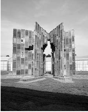
sl.13. Ai Weiwei, Template , 2007. © Courtesy the artist; Galerie Urs Meile, Beijing-Lucerne; Photos: Frank Schinski / documenta GmbH