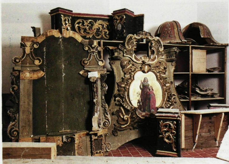
5. Sjeverni depo Restauratorskog centra Ludbreg, Evakuirani dijelovi arhitekture glavnog oltara crkve Sv. Nikole u Jasenovcu. (V. Barac, DUZKB, 1996.)

Uglavnom je riječ o crkvenom inventaru, odnosno o drvenim polikromiranim ( mramorizacija ) i pozlaćenim oltarima arhitektonskog tipa 7 sa skulpturama, florealnim ukrasima, palama i sl.. Svi su oni bili djelomice oštećeni u ratnom vihoru i evakuirani su iz svojih ambijenata, a oko 90% tih objekata je u 19. st. preslikano te je skriven njihov autohtoni izgled i stoga je potrebno skidati ( strapirati ) naknadni sloj boje. Naravno, oštećeni su i na druge načine ( nepravilnim rukovanjem, cvotočinom, različitim onečišćenjima itd... ). Na tim se objektima najprije radilo otprašivanje, podljepljivanje slikanog sloja, restitucija i konsolidacija objekta, a nakon provedenih restauratorsko-konzervatorskih istraživanja i skidanje preslika i otkrivanje originalnog izgleda objekta. Kasnije je izvedeno kitanje, krediranje, retuš ili pozlata te