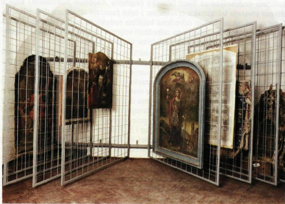
6. Istočni depo Restauratorskog centra Ludbreg. Evakuirane slike iz Šišinca, Sunje, Tomaša itd. (Foto: V. Barac, DUZKB, 1996.)

zaštita slikanog sloja i dezinfekcija. Svi su radovi popraćeni fotografijama i elaborirani su. Početkom 1998. god. započeti su restauratorsko-konzervatorski radovi na obnovi inventara crkve Sv. Marije Magdalene iz Sunje, a u depoima RCL-a na svoju obnovu čekaju još mnogobrojni evakuirani objekti iz Jasenovca, Sunjske Grede, Tomaša, Logorišta, Cernika, Požege itd.