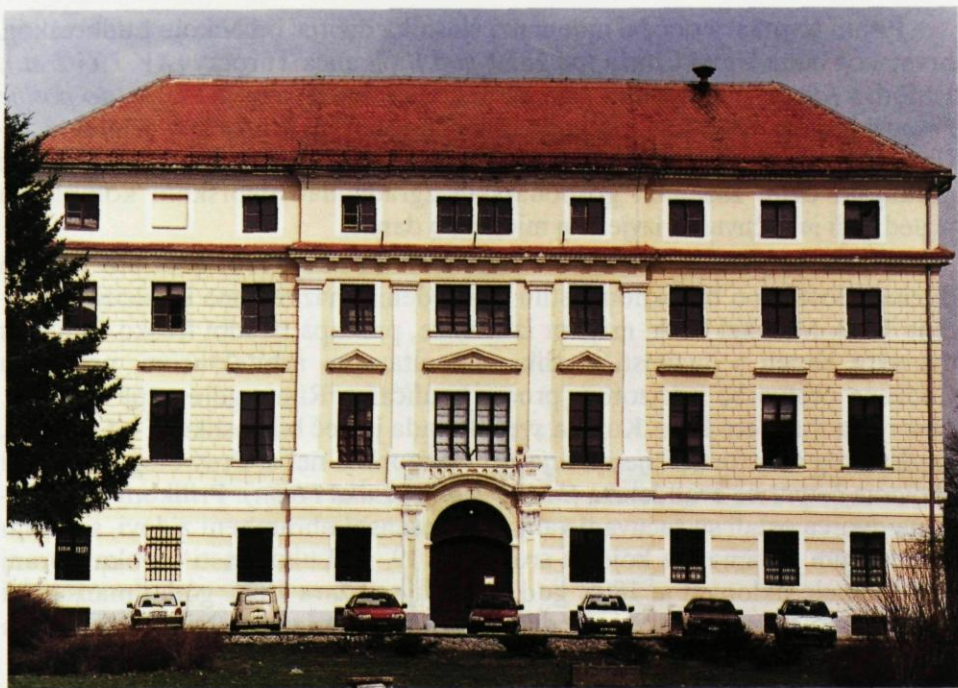
2. Dvorac Batthyany - Restauratorski centar Ludbreg, glavno južno pročelje s portalom i rizalitom.

otkrivenim ispod slojeva žbuke na drugom katu zapadnog krila dvorca ( stara kula ). Nedavna su restauratorsko-konzervatorska sondiranja zida pokazala da su prilikom preinake dvorca u 18. st. mnogi arhitektonski fragmenti iz ranijih razdoblja ( gotike i renesanse ) korišteni kao spolije.