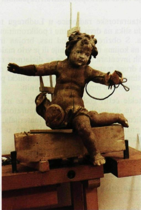
8. Drvorezbarska radionica. Restauratorski radovi na anđelu s oltara Sv. Barbare iz crkve Sv. Marije Snježne u Belcu.