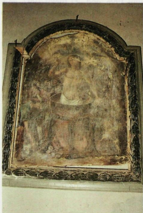
3. Oltarna pala Sv. Vida iz Kapele Sv. Vida u Jamničkom Podgorju s ukrasnim okvirom, stanje prije restauratorsko-konzervatorskih intervencija.