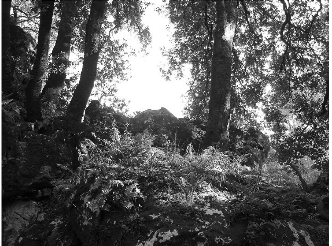
sl. 8. Biljna raznolikost

ptičji pjev ovdje poseban, a jeka neočekivano zvučna. Koga je to priroda zaštitila od svih vjetrova, pa smirila vrelinu ljeta i otupila oštricu zime?! Vile!