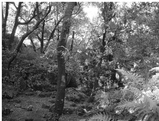
sl. 6. Vilinski ugodaj.