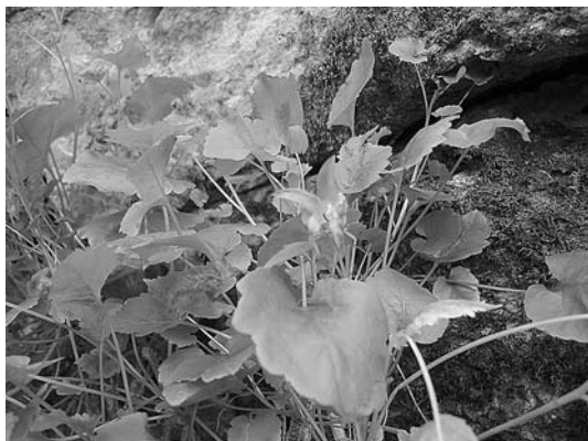
sl. 5. Campanula portenschlagiana