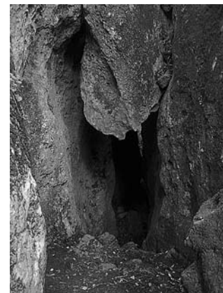
sl. 7. Kameni oblici prirode