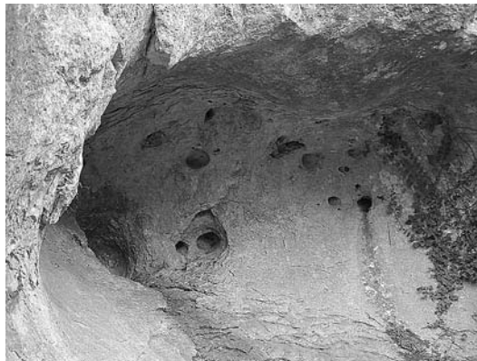
sl. 9. Kočje i Mjesec.