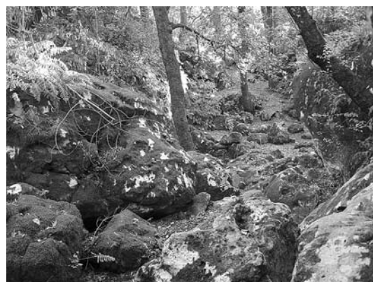
sl. 1. Kok na ulazu