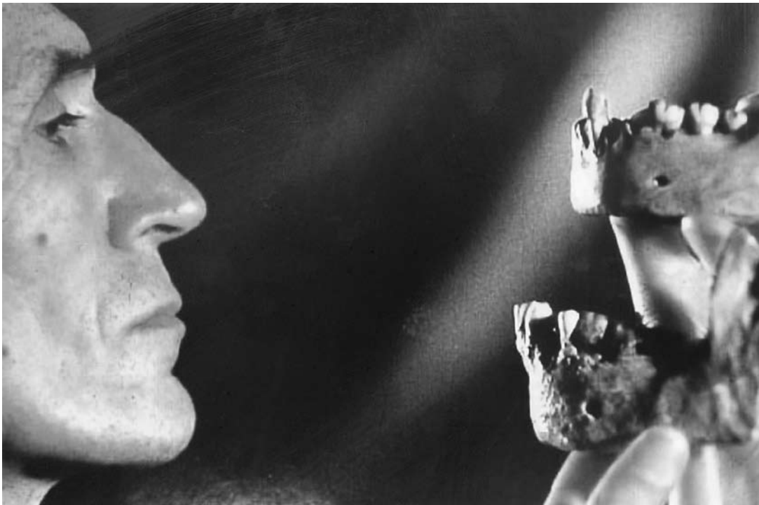
sl. 2. Licem u lice s ostacima neandertalaca. Fotografija iz časopisa National Geographic Magazine