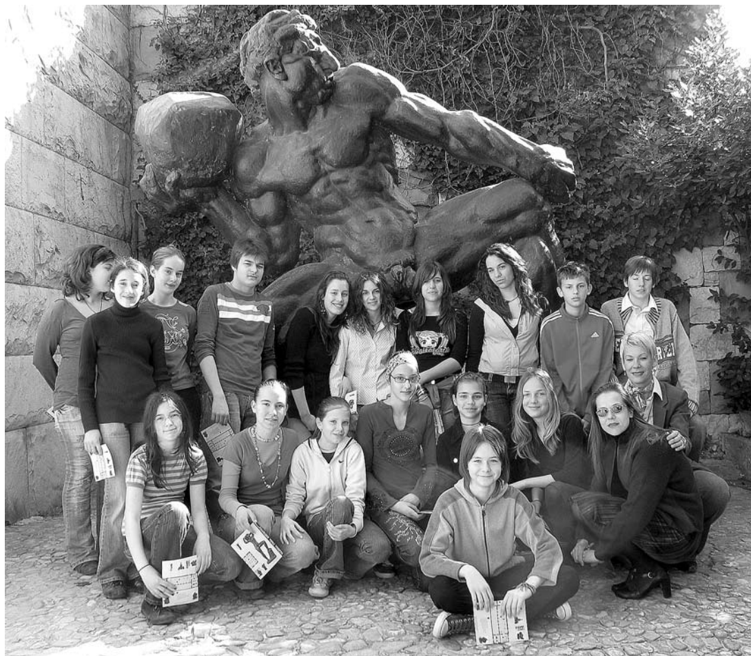
sl. 1. Polaznici muzejsko-edukativne radionice Osnivamo muzej!

MAJA ŠEPAROVIĆ PALADA □ Muzeji Ivana Meštrovića, Galerija Ivana Meštrovića, Split