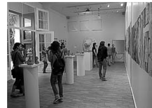
sl. 11. Izložba