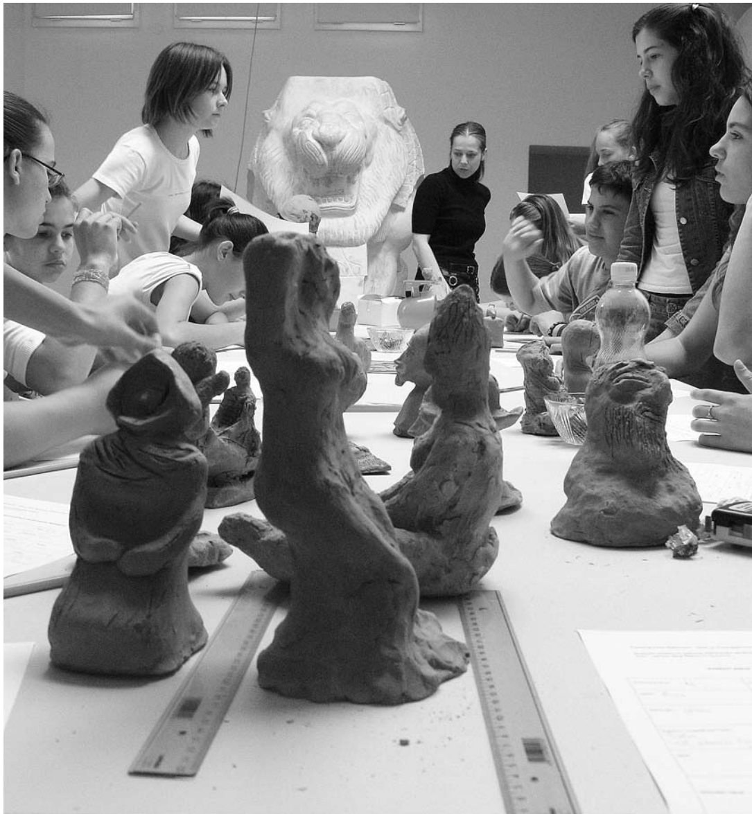
sl. 10. Radionica