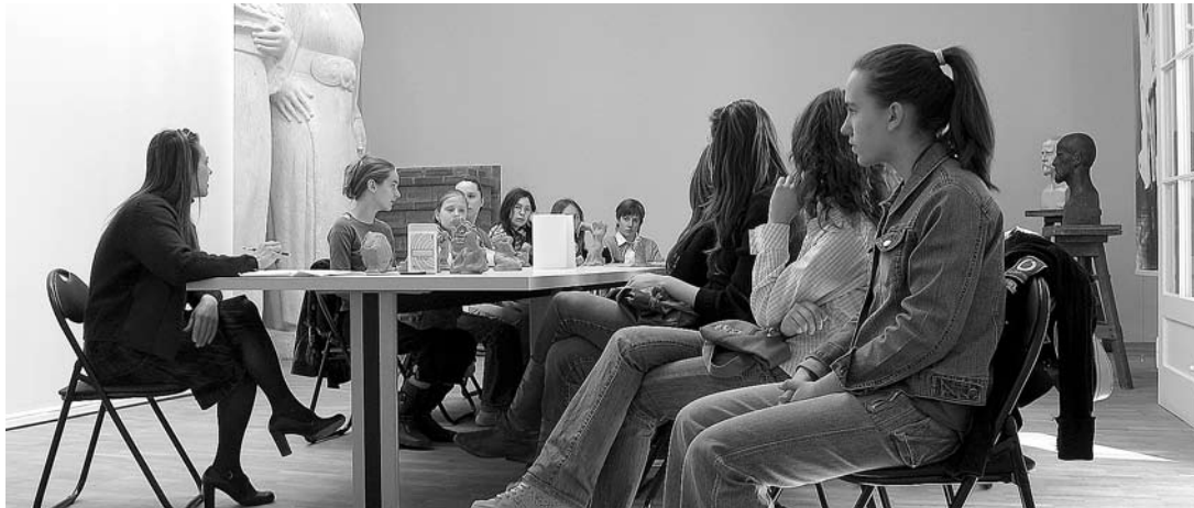
sl. 2. - 3. Radionica u Galeriji Ivana Meštrović, Split, 2007.