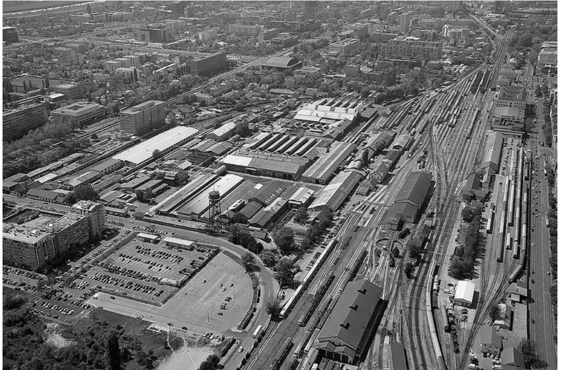
sl. 5. Pogled na kompleks Tvornice željezničkih vozila "Gredelj", 2007.