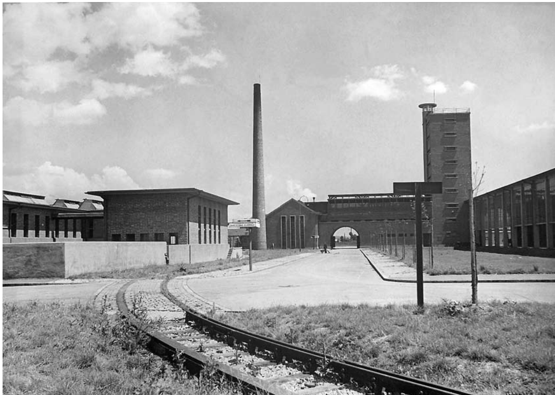
sl. 6. Gradska klaonica, 1931.