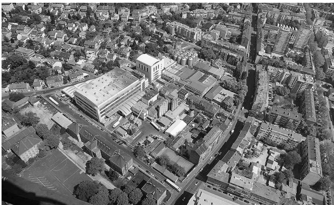
sl. 10. Kompleks Zagrebačke pivovare, 2007.

multidisciplinarni pristup, kojemu u prikazu nacionalne, regionalne ili lokalne povijesti posljednjih godina pribjegavaju muzejske ustanove u Europi, Hrvatski povijesni muzej povećao bi kvalitetu i kompleksnost prezentacije te nametnuo nužno potreban novi odnos prema vrednovanju i shvaćanju industrijske baštine kao kulturnog resursa. 17