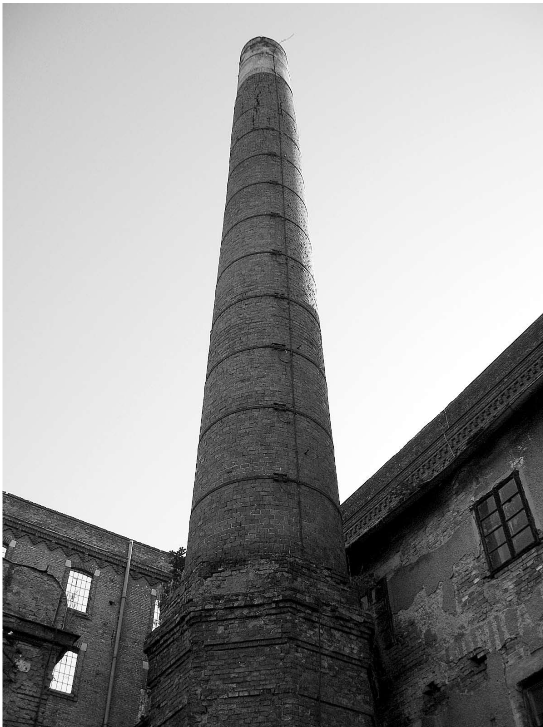
sl. 11. Pogled na paromlinski dimnjak, 2008.

The main problem inheres in the lack of awareness of the need to preserve the industrial heritage and of ideas about its development potentials, from which derives a shortage of interest and concrete ideas. Early industrial structures in the city of Zagreb on the whole are located on attractive sites and financial interests are often way ahead of heritage concerns, which is aided by the economic logic in thinking about their future and the traditional way of perceiving culture. This kind of approach must necessarily be changed and reassessed, for otherwise there is likely to be a total