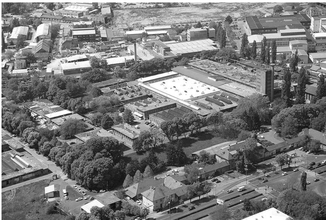
sl. 7.- 8. Kompleks Zagrepčanka (nekadašnja Gradska klaonica), 2007.