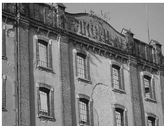
sl. 2. Ostaci Paromlina, 2007.