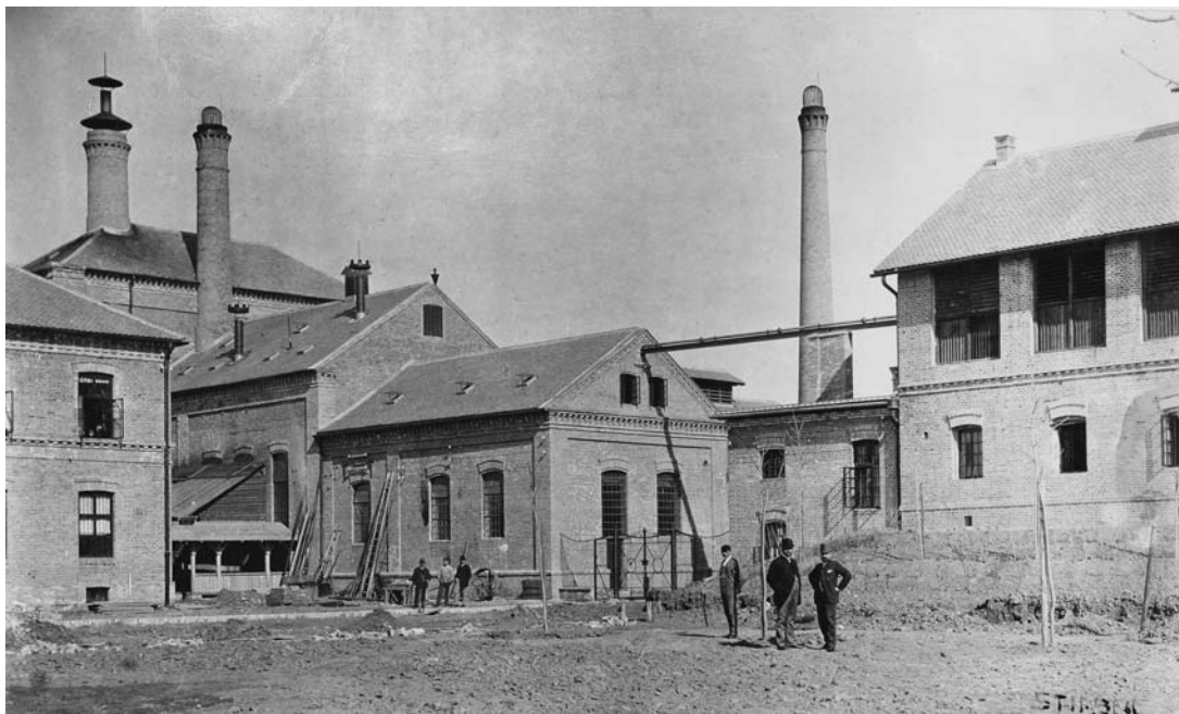
sl. 9. Zagrebačka pivovara u vrijeme izgradnje, 1892.