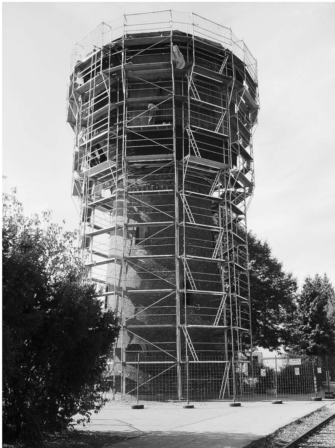
sl. 13. Vodotoranj iz 1871. godine, koji je dio ložioničkog kompleksa u Osijeku, obnovljen je 2006. godine.

In Croatia there was first any discussion of the identification and evaluation of the industrial heritage in the 1980s. After this came plans for and considerations of the revitalisation and change of purpose of factories and industrial plant that had ceased to be used for their original purpose. Within the body of the valuable industrial heritage an important place belongs to the workshops, railway buildings and other auxiliary structures of the railway system that started to develop in Croatia in 1860. Among these complexes, which are gradually being released