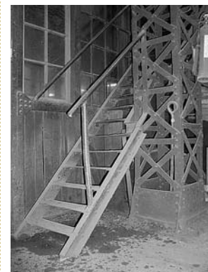
sl. 6. Detalj krovišta od stakla, čeličnih konstrukcija i drvenih elemenata.