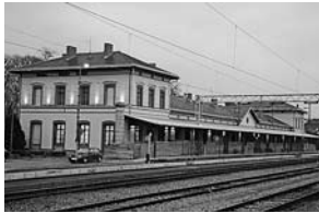
sl. 8. Prijamna zgrada prvoga zagrebačkog kolodvora, Zagreb – Zapadni kolodvor.