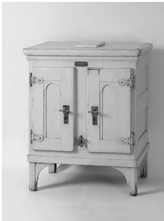
sl. 14. Hladnjak – ormar za led Mohaç, Mađarska, oko 1920.