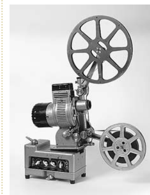
sl. 8. Filmski projektor Debrie 16 model MB 15 Pariz, Francuska, oko 1930.

Oliver i Remington , proizvedeni početkom 20. st. Prema otisnome mehanizmu, nosači njihovih tiskovnih slova i znakova su cilindar i poluge. Osim pisaačih strojeva kao najbrojnijih predmeta, podzbirka ima i šiljilo za olovke s kraja 19. st., produživač olovke, držalo za pero, šest računskih strojeva – zbrajalica i množilica na ručni i električni pogon te fotokopirne aparate, osobna računala i bušilice za papir.